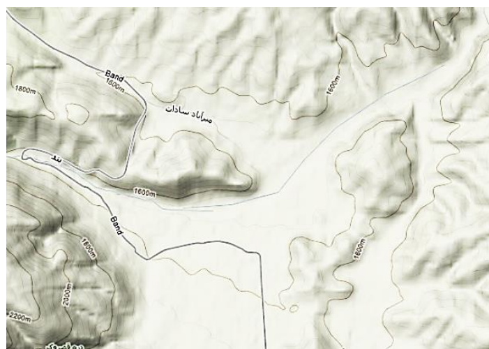
شکل ۲. وضعیت توپوگرافی ناحیه سیلوانا

شیب سایت سیلوانا بسیار مناسب و حدود ۶ درصد است. شکل اراضی سایت از نوع دشتی و اطراف آن توپوگرافی و حالت دانه‌لوبیایی است.