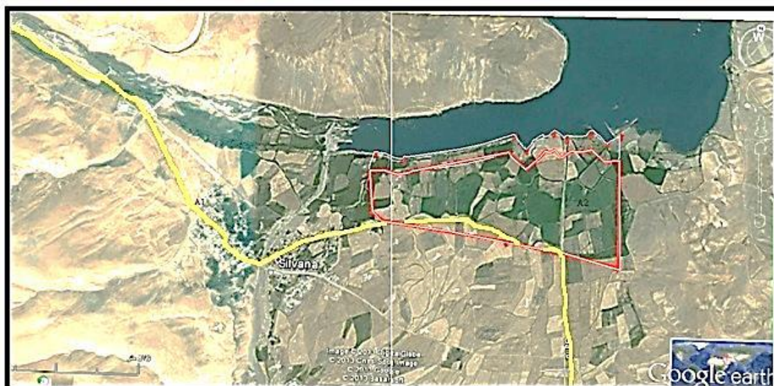
شکل ۳. منظره هوایی از دسترسی سایت

این سایت، دسترسی خشکی و آبی دارد. می‌توان با استفاده از قایق، از نواحی شرقی و غربی سایت به بخش آبی آن دسترسی داشت. در بخش خشکی، سایت براساس ساختار شبکه اصلی جاده‌ها شکل گرفته که از یک حلقه اصلی تشکیل شده است. حلقه اصلی به ورودی شهرک پیوند می‌خورد. این حلقه، در گوشه جنوب شرقی قرار گرفته است. برای تکمیل راه‌های ارتباطی، یک بلوار شمالی- جنوبی در مرکز شهرک، به‌عنوان محور اصلی برای ارائه خدمات و یک بلوار شرقی- غربی نیز برای دسترسی آسان‌تر، علاوه بر راه‌های فرعی در داخل سایت برای بازدیدکنندگان پیش‌بینی شده است.