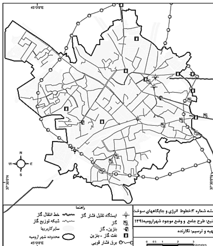
نقشه ۲. خطوط انرژی و جایگاه سوخت

پمپ‌های بنزین پتانسیل آسیب‌رسانی بالایی دارند و هنگام بحران احتمال خطر آن‌ها افزایش می‌یابد؛ بنابراین، همواره باید در انتخاب کاربری‌های همسایه آن‌ها دقت شود؛ زیرا در صورت ایجاد مشکل به نسبت فاصله با آن‌ها، طیف آسیب‌پذیری تغییر می‌کند (حبیبی و دیگران، ۱۳۹۲: ۸۵).