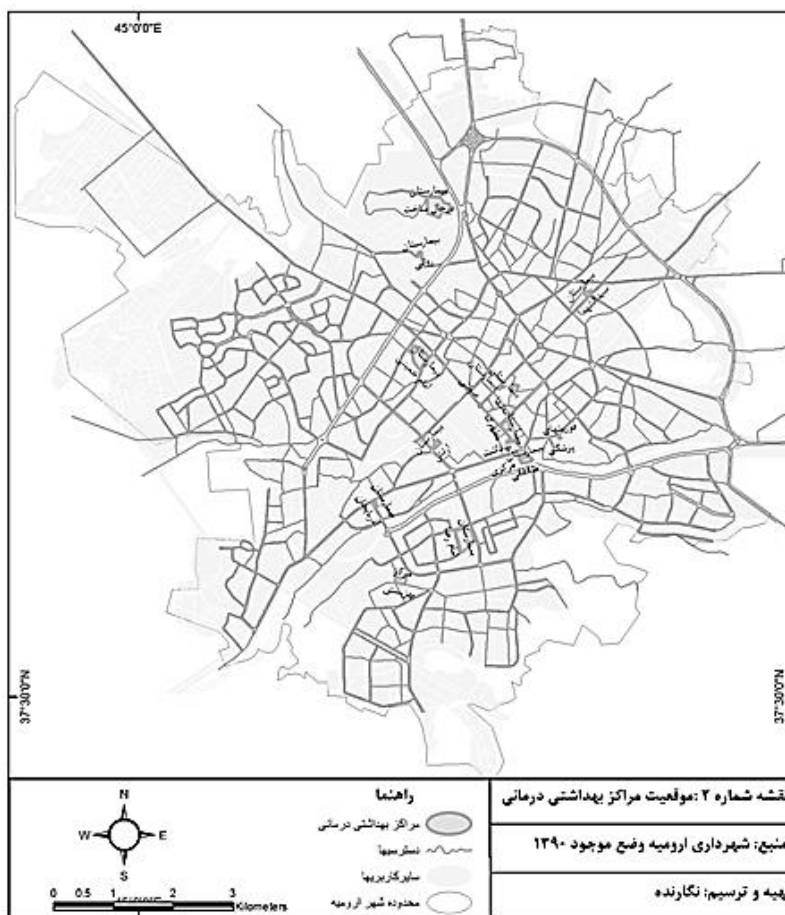
نقشه ۱. موقعیت مراکز درمانی و بهداشتی در ارومیه

مرکزی، یک مرکز بهزیستی و ۱۳ بیمارستان دارد که بعضی از آن‌ها از جمله بیمارستان سیدالشهدا تخصصی هستند. نقشه ۱ موقعیت مراکز درمانی و بهداشتی را در سطح شهر ارومیه نشان می‌دهد.