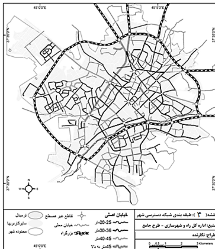
نقشه ۴. طبقه‌بندی شبکه دسترسی شهر