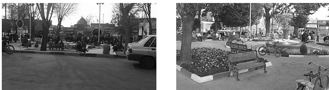
تصویر ۲. زندگی اجتماعی عمومی پویا و غنی در سبزه‌میدان

از سوی دیگر، بازار از زمان احداث تا امروز جزء عناصر اصلی ساختار شهر بوده است و یکی از باثبات‌ترین عناصر کالبدی شهر محسوب می‌شود که علی‌رغم به‌وجود آمدن تغییراتی در ماهیت تجاری آن، همچنان تأثیر غیرقابل‌انکاری بر ساختار اقتصادی و اجتماعی محیط اطراف خود دارد. مهم‌ترین فضایی که در ارتباط با بازار تعریف شده، سبزه‌میدان است که از گذشته تاکنون، همواره نقش یک مکان سوم کارآمد را ایفا می‌کند و مانند مسجد، فرم و عملکرد خود را تقریباً حفظ کرده است. سبزه‌میدان عرصه‌ای پویاست که با وجود تغییراتی اساسی در محیط اطراف آن، همچنان به‌عنوان یک مکان جمع‌شدن عمومی کارا عمل می‌کند. این تغییرات عبارت‌اند از: حذف عملکردهای مؤثری که در گذشته در اطراف آن وجود داشته است، تغییرات کالبدی عظیم و تخریب‌های گسترده در بدنه‌های اطراف، تغییر گروه‌های اجتماعی استفاده‌کننده غالب و جایگزینی بازنشستگان و سالمندان به‌جای خانواده‌ها.