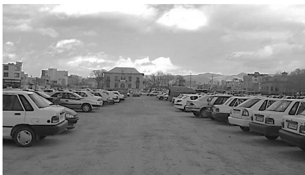
تصویر ۳. تخریب‌های کالبدی ضلع شمالی سبزه‌میدان

علی‌رغم تنوعی که در مکان‌های سوم بررسی شد، مشاهده می‌شود که در محدوده سبزه‌میدان، تغییر چندانی حاصل نشده و تنها برخی از مکان‌ها حذف شده‌اند. بدین ترتیب، در عمل فضاهای تعریف‌شده در این محدوده در سه دوره بررسی شده یکسان‌اند و درحال حاضر، بارزترین مکان‌های سوم، محدوده سبزه‌میدان، مسجد جامع و خود فضای اصلی سبزه‌میدان هستند. به‌جز این دو مکان، تقریباً همه مکان‌های سومی که در این محدوده وجود داشتند، از بین رفته‌اند. از سوی دیگر، مرکزیت اجتماعی سبزه‌میدان نیز به‌شدت رو به افول است و طرح‌های شهری و تخریب‌های کالبدی ناشی از این طرح‌ها، وضعیت این محدوده را بدتر از پیش می‌کند. با توجه به تمامی مباحث مطرح‌شده، به‌نظر می‌رسد پتانسیل غیرقابل‌انکار مکان‌های سوم در راستای تعدیل جدایی‌گزینی‌های اجتماعی، اختلاط طبقات اجتماعی، رفع تبعیض جنسیتی و مهم‌تر از همه، ارتقای حیات مدنی و گسترش حوزه عمومی را می‌توان عامل محکمی برای حرکت مسئولان به‌سمت احیا و بازآفرینی این مکان‌ها، کنترل آسیب‌های اجتماعی آن‌ها در راستای افزایش کنش‌های مثبت اجتماعی شهروندان، گسترش فضاهای گفت‌وگو و تبادل نظر و در نتیجه، توسعه حوزه عمومی به‌شمار آورد.