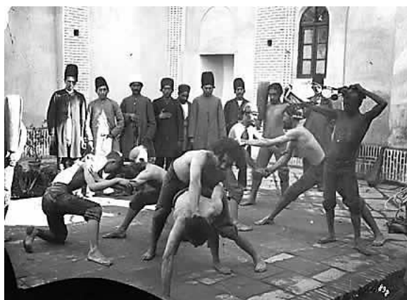
تصویر ۱. نمایی از یک زورخانه (یکی از مکان‌های سوم با ماهیت مذهبی)

مسجد جامع نیز اهمیت فراوانی داشت. حیاط مسجد یکی از مکان‌های جمع‌شدن عمومی پرمخاطب شهر بود که با داشتن فضایی دینی، محبوبیت زیادی در میان شهروندان پیدا کرده بود. از ساعتی پیش از اذان ظهر و عصر تا ساعتی پس از آن، مردم به مسجد مراجعه و درباره مسائل روز گفت‌وگو می‌کردند. حضور رهبران دینی و بزرگان شهر نیز این جمع‌ها را پررونق‌تر می‌کرد. در ساعات دیگر روز نیز افراد به‌صورت پیوسته به حیاط مسجد مراجعه می‌کردند و ساعات فراغت خود را در آنجا می‌گذراندند.