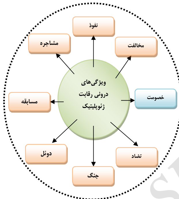
شکل ۲. ویژگی‌های درونی رقابت ژئوپلیتیک

رقابت ژئوپلیتیک در صورت تداوم ممکن است به منازعه ژئوپلیتیکی منجر شود. این امر زمانی حادث می‌شود که قدرت‌های رقیب کوشش کنند موقعیت خویش را با تنزل دادن موقعیت دیگران یا ممانعت از آن‌ها تقویت کنند و ارتقا دهند و مانع دستیابی دیگران به اهدافشان بشوند، همچنین در ادامه رقبا خود را از دور خارج کنند و به انزوا ببرند. در رقابت ژئوپلیتیک، منافع مشترک مادی و معنوی جای خود را به منافع تقابلی می‌دهد؛ زیرا از منافع مشترک، همکاری، پیمان و ژئوپلیتیک صلح، اما از منافع تقابلی، رقابت، منازعه و جنگ حاصل می‌شود. بازیگران براساس منافع متعارض با هم رقابت می‌کنند تا رقیب را از دستیابی به فرصت‌ها بازدارند. رقابت با هدف کسب برتری و سیادت در زمینه خاص بین بازیگران انجام می‌شود. رقابت اشکال مختلفی دارد: