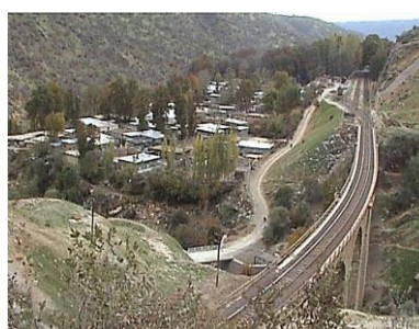
عکس ۱. نمایی از دید و منظر روستای ایستگاه بیشه