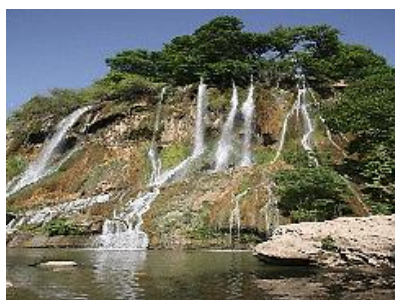
عکس ۲. نمایی از آبشار بیشه

۹. بازارچه محلی یکی از مراکز دیدنی و جالب روستاست که در آن انواع تولیدات روستا از قبیل صنایع دستی، لبنیات و محصولات باغی به فروش می‌رسد. انواع صنایع دستی، هنر، پوشش محلی، انواع غذاها، موسیقی، آداب و رسوم و جشن‌های محلی روستا را می‌توان از سایر جاذبه‌های روستا به‌شمار آورد. روستای ایستگاه بیشه، به دلیل قرار داشتن در مسیر راه‌آهن سراسری تهران-خوزستان و دسترسی آسان و سایر موارد گفته‌شده، موقعیت مطلوبی برای جذب گردشگر دارد. در این بین، یکی از مهم‌ترین مناطقی که از نظر تفریحی شباهت بسیاری با روستای اکوتوریستی ایستگاه بیشه، و در رقابت با آن قرار دارد روستای گریت در مجاورت ایستگاه بیشه است که به دلیل داشتن آبشار بسیار زیبایی گریت، یکی از مناطق تفریحی مهم در استان لرستان محسوب می‌شود.