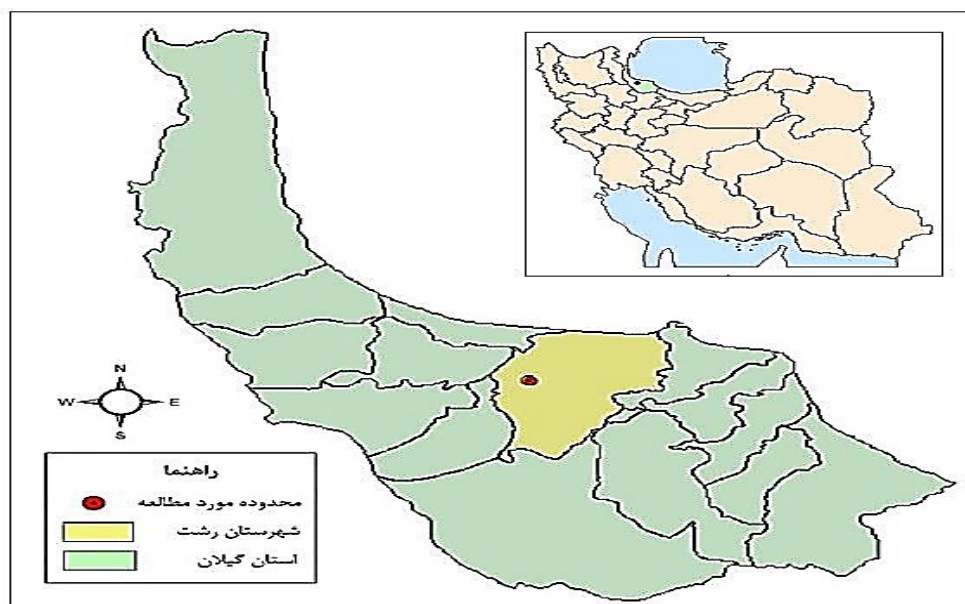
شکل ۱. نقشه موقعیت محدوده مورد مطالعه در تقسیمات سیاسی کشور و استان

محدوده مورد مطالعه شهر رشت از توابع استان گیلان در شمال ایران است که در ۴۹ درجه و ۳۶ دقیقه طول شرقی و ۳۷ درجه و ۱۶ دقیقه عرض شمالی واقع شده است. براساس سرشماری رسمی سال ۱۳۹۰، جمعیت این شهر ۹۵۱۶۳۹ نفر است و ۲۰۴۰۰۵۴ خانوار در آن ساکن هستند. محدوده استحفاظی براساس طرح جامع این شهر در سال ۱۳۸۶، ۱۶۰۱۸۸ هکتار است (مهندسان مشاور طرح کاوش، ۱۳۸۶: ۹) (شکل ۱).