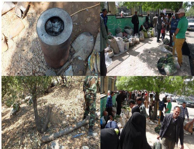
شکل ۲. بهره‌برداری از گیاهان کوهی و تهیه زغال در سکونتگاه‌های مورد مطالعه

تخریب منابع محیط طبیعی در میان ساکنان روستاهای پیرامون شهر یاسوج بیشتر به‌صورت جمع‌آوری گیاهان خوراکی، دامی و طبی است که برای مصرف خانگی و فروش برای کسب درآمد است. یکی از روش‌هایی که با استفاده از آن ساکنان این روستاها خواسته یا ناخواسته سبب تخریب محیط می‌شوند، قطع درختان (برای زغال و پخت‌وپز) است. برداشت بی‌رویه و غیراصولی گیاهان کوهی در کهگیلویه و بویراحمد برای فروش و کسب درآمد بسیاری از این گیاهان با ارزش را ریشه‌کن کرده است. به‌نظر می‌رسد فقر اقتصادی خانوارها مهم‌ترین عامل بهره‌برداری بی‌رویه از گیاهان کوهی در روستاهای مورد مطالعه است. از دیگر مواردی که سبب تخریب محیط‌زیست می‌شود، قطع درختان جنگلی برای تهیه زغال است.