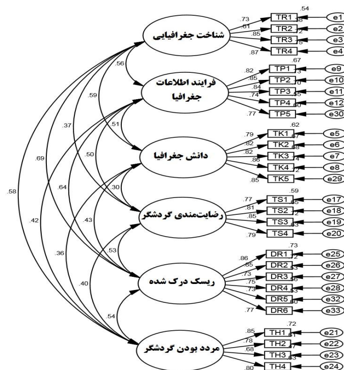
شکل ۲. برازش مدل مفهومی پژوهش