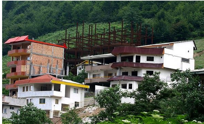
تصویر ۲. نمایی از ساخت و ساز در محدوده منابع طبیعی منطقه دماوند