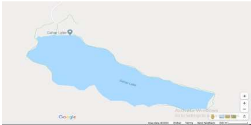
شکل ۱. نقشه دریاچه گهر

ایران از جاذبه‌های طبیعی گردشگری فراوانی برخوردار است که از آن جمله دریاچه گهر است. دریاچه گهر دریاچه‌ای کوهستانی است که در میان رشته کوه اشتران کوه استان لرستان با ارتفاع ۲۳۵۰ متر از سطح دریا واقع شده است و حدود ۱۷۰۰ متر درازا و ۴۰۰ تا ۸۰۰ متر پهنا و ۴ تا ۲۸ متر ژرفا دارد. این دریاچه در منطقه حفاظت‌شده اشتران کوه شهرستان دورود قرار دارد که به نگین اشتران کوه معروف است و به علت نداشتن راه ماشین‌رو منطقه بکری است و تا حد زیادی در امان مانده است از گزند انسان. سالانه حدود ۷۰.۰۰۰ گردشگر از این منطقه بازدید می‌کنند. مسیر اصلی دریاچه از شهرستان دورود شروع می‌شود و پس از طی مسافت حدود ۱۸ کیلومتر به انتهای آسفالت‌شده جاده می‌رسد. از این نقطه تا رسیدن به دریاچه گهر حدود پنج ساعت پیاده‌روی لازم است (سایت دریاچه گهر، ۱۳۹۸).