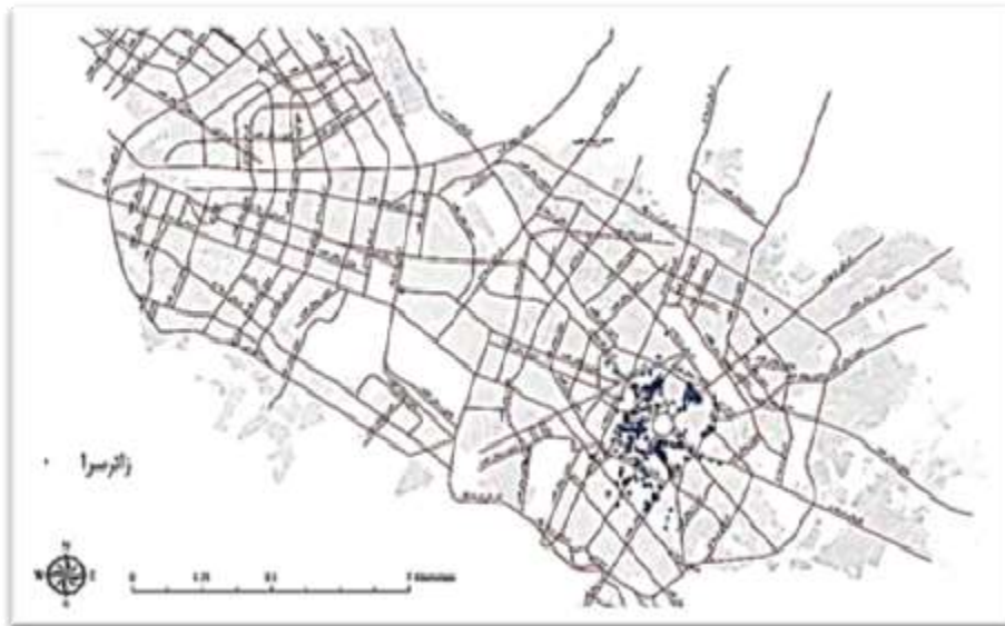
شکل ۲. نحوه پراکنش زائرسراهای اوقافی در سطح شهر مشهد

بر اساس اطلاعات اداره کل اوقاف خراسان رضوی، در حال حاضر تعداد زائرسراهای اوقافی این استان حدوداً ۲۹۵ مورد است. ۱ ملیت بیشتر مراجعه‌کنندگان ایرانی و از شهرهای مختلف ایران است، اما منحصراً زائرسراهایی برای افراد پاکستانی وجود دارد که تعداد آنها اندک است و اداره اوقاف استان نظارت آنها را بر عهده دارد. اسکان در این دسته از زائرسراها عمدتاً به صورت کاروان (گروهی) صورت می‌گیرد. ۸۰ درصد مراجعه‌کنندگان از نظر جنسیت مرد هستند. این زائرسراها فقط پذیرای میهمانان شیعه‌اند و از پذیرفتن افراد اهل تسنن و سایر مذاهب اجتناب می‌ورزند.