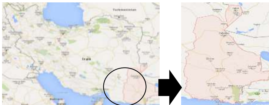
شکل ۳. موقعیت جغرافیایی استان سیستان و بلوچستان

خراسان جنوبی، از جنوب به دریای عمان، از شرق به کشورهای پاکستان و افغانستان، و از غرب به استان‌های هرمزگان و کرمان محدود شده است (پورتال استان سیستان و بلوچستان، ۱۳۹۳). مساحت استان ۱۸۷۵۰۲ کیلومتر مربع است که ۱۱٫۵ درصد از وسعت کشور را دربر می‌گیرد. این استان بین ۲۵ درجه و ۳ دقیقه تا ۳۱ درجه و ۲۹ دقیقه عرض شمالی و ۵۸ درجه و ۴۹ دقیقه تا ۶۳ درجه و ۲۰ دقیقه طول شرقی واقع شده است (گزارش اقتصادی، اجتماعی، و فرهنگی استان سیستان و بلوچستان، ۱۳۹۰: ۲). بر اساس آخرین تقسیمات کشوری این استان دارای ۱۴ شهرستان، ۳۷ مرکز شهری، ۴۰ بخش، ۱۰۲ دهستان، و ۹۲۳۶ آبادی کددار است (گزارش اقتصادی، اجتماعی، و فرهنگی استان سیستان و بلوچستان، ۱۳۹۰: ۲).