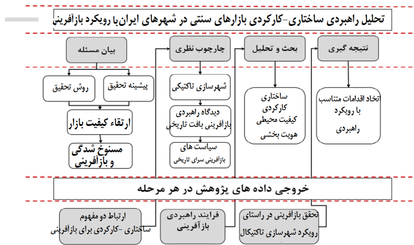
شکل شماره ۲. چارچوب مفهومی تحقیق

شهرسازی مبتنی بر تحولات ساختاری- کارکردی یک مفهوم کلی است که برای توصیف مجموعه‌ای از تغییرات موقت و کم‌هزینه در محیط ساخته شده استفاده می‌شود. این تغییرات عموماً در شهرها انجام می‌شود و هدف آن بهبود وضعیت محلات و مکان‌های عمومی است. از شهرسازی تاکتیکی با عناوین دیگری نظیر شهرسازی پاپ آپ، شهرسازی چریکی (نامنظم و آموزش ندیده)، تعمیر شهری، یا شهرسازی «خودت انجامش بده» ۱ یاد می‌شود (دیجی، ۱۳۹۰: ۴۲). به عبارتی دیگر، رویکرد تاکتیکی شامل انواع شیوه‌های ابتکاری است و استراتژی‌ها و پتانسیل طراحی شهری با استفاده از تأسیسات و امکانات موقت را بررسی می‌کند. برخی از این شیوه‌ها چند ساعت طول می‌کشد. در حالی که برخی از آن‌ها می‌توانند برای مطالعات گسترده‌ای که ممکن است تا یک سال ادامه یابند استفاده شوند. به‌طور کلی شهرسازی تاکتیکی را می‌توان رهیافت نوینی تعریف کرد که پایه و اساس آن مشارکت مردم است و استفاده از پروژه‌های کوتاه‌مدت و زودبازده از ویژگی‌های مهم آن است. شهرسازی تاکتیکی نیاز به در نظر گرفتن بعضی از اصول طراحی دارد تا بتواند فضاهای عمومی پُرجنب‌وجوش و پویا را ایجاد کند (اسمیت و همکاران، ۱۳۹۴ به نقل از زارع و همکاران، ۱۳۹۸: ۱۳۸).