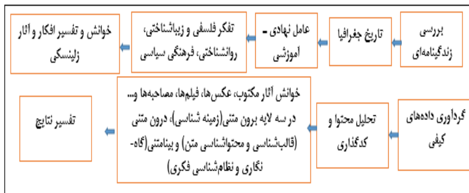
شکل شماره ۱. مدل ترکیبی تحلیلی روش پژوهش بیوگرافیکی - تفسیری با الهام از جان کرتلند رایت

تفسیری و روایتگری بیان گردید. از سوی دیگر یکی از ویژگی‌های این جستار، قرار دادن تحولات فکری زلینسکی در «روش‌شناسی‌های بیوگرافیکی درون تاریخ نظریه اجتماعی، و همچنین ارائه نمونه‌ای سودمندی از فرایندهای تفسیر است که بر مبنای مصاحبه‌ها و سطوح دیگری از نظریه‌سازی داده‌ای» (چمبرلین و همکاران، ۲۰۰۰: ۲) پیش برده شده است. البته یادآور می‌شود که در بیان فقرات تفسیری به روایت نگارندگان، این تقسیم‌بندی به حصر منطقی صورت نگرفته و صبغه استقرایی دارد، لازمه این سخن این است که علی‌الاصول می‌توان از مواجهه‌های دیگری با مقوله آثار و اندیشه زلینسکی نیز سراغ گرفت و مقومات آن‌ها را برشمرد.