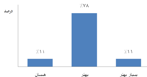
نمودار ۳- نظر مونتاژکاران در مورد شرایط کار هنگام استفاده از لنز بزرگنمایی در مقایسه با قبل (n=۷۳).

کار قبل از مداخله بوده است. این موضوع گویای آنست که مداخله (استفاده از لنز بزرگنمایی چشمی) تاثیر قابل توجه و معنی داری در کاسته شدن از شدت ناراحتی در نواحی یاد شده داشته و از اینرو به نظر می‌رسد در کاهش وقوع اختلالات در این نواحی موثر باشد. در مطالعات مختلفی که بر روی تاثیر استفاده از لنز بزرگنمایی بر بهبود پوسچر دندانپزشکان انجام شد، مشخص گردید که استفاده از این لنزها تاثیر چشمگیری بر بهبود پوسچر نواحی گردن و تنه دارد