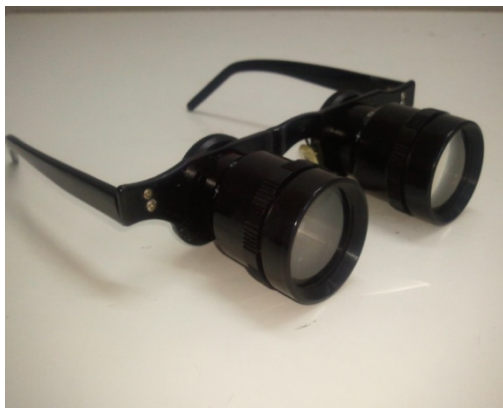
شکل ۱: لنز بزرگنمایی چشمی مورد استفاده در مطالعه.

شیفت کار ماکول نشد، زیرا افراد در ساعت آخر به ضبط و ربط ایستگاه کار خود پرداخته و دیگر به کار اصلی خود یعنی مونتاژ مدارهای الکترونیکی نمی‌پردازند.