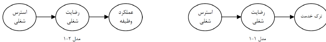
شکل ۱- الگوهای نظری و مفهومی رابطه بین متغیرهای پژوهش

تأیید الگوهای نظری و مفهومی ارائه شده (شکل ۱)، زمینه بسط و گسترش نظری، پژوهشی و کاربردی یافته‌های این پژوهش فراهم می‌گردد. پیلی (Paille) بر این نظر تأکید نموده که نقش واسطه‌ای رضایت شغلی در رابطه میان استرس شغلی با ترک خدمت دارای تلویحات کاربردی بااهمیتی برای سازمان‌ها است [۲۰]. باور پژوهشگران پژوهش حاضر بر این است که همین امر در مورد عملکرد وظیفه نیز قابل ذکر است. بنابراین هدف اصلی این پژوهش بررسی دو الگوی ارائه شده در شکل ۱ در نظر گرفته شد تا شواهد و حمایت کاربردی برای کاهش ترک خدمت و تقویت عملکرد وظیفه در محیط‌های کار فراهم شود.