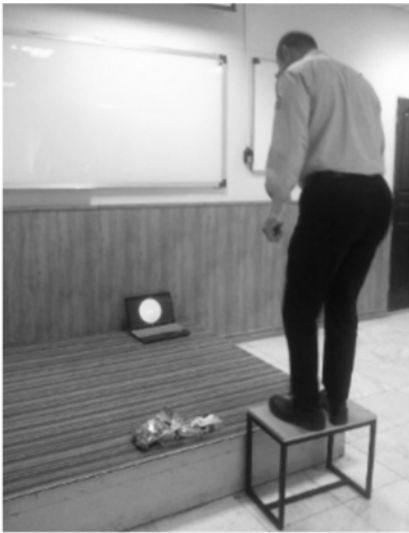
شکل ۱- یکی از افراد شرکت کننده در مطالعه در حین اجرای تست پله

در محیط اجرای آزمون نیز پزشک و همچنین فرد مسلط به کمک‌های اولیه جهت اطمینان از اقدام درمانی مناسب در صورت بروز علائم و اختلال در سلامت افراد در حین انجام تست حضور داشتند. به افراد شرکت کننده در مطالعه توضیح داده شد که در صورت بروز خستگی یا هر گونه وجود ناراحتی می‌توانند از اجرای ادامه آزمون انصراف دهند. اخذ رضایت‌نامه از نمونه‌های پژوهش، دادن اطلاعات کافی به هریک از نمونه‌ها، آزاد بودن کلیه واحدهای پژوهش در رد یا قبول شرکت در مطالعه و ایجاد اطمینان از محرمانه بودن اطلاعات واحدهای پژوهش از جمله موارد اخلاقی پژوهش بودند. برای تحلیل داده‌ها، از نرم‌افزار SPSS19 و روش‌های آمار توصیفی و استنباطی (آزمون‌های U من‌ویتنی، کروسکال والیس و ضریب همبستگی پیرسون) استفاده شد.