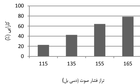
شکل ۲- تغییرات کارایی انباشت آکوستیکی در ترازهای مختلف فشار صوت

نتایج حاصل از آزمایش‌ها نشان داد که میانگین کارایی فیلتراسیون آکوستیکی به ترتیب در ترازهای فشار صوت ۱۱۵، ۱۳۵، ۱۵۵ و ۱۶۵ دسی‌بل برابر ۲۲/۷۵، ۴۲/۵۴ و ۶۴/۲۷ و ۷۸/۶۹ بدست آمد. نتایج آزمون آماری نشان داد که تفاوت معنی‌داری در میزان کارایی در ترازهای مختلف فشار صوت وجود دارد ( P=0/001 ).