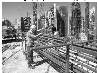
آرما توری بندی ایستاده و در ارتفاع کمر