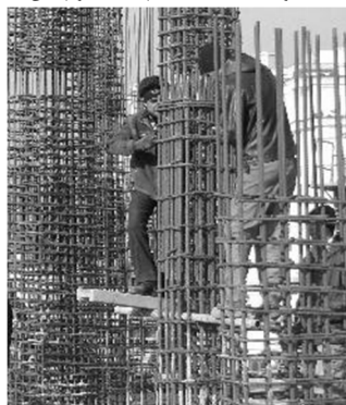
آرما توری بندی ایستاده و در ارتفاع شانه