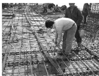
آرما توری بندی در حالت چمباتمه و پایین

است. همچنین ۹ فردی که برای انجام این آزمایش انتخاب شده‌اند دارای ابعاد آنتروپومتری بین صدک ۵ تا صدک ۹۵ هستند که این ملاحظه هم برای بررسی اثر ابعاد آنتروپومتری در ریسک کاری کارگران در کارهای مختلف مد نظر قرار گرفته است. فشار کاری مرتبط با هر کار و هر نفر (نیروی وارد به کمر) که از میانگین آزمایشات حاصل شده، در جدول شماره ۳ آمده است. پس از تعیین نیروی وارد بر کمر برای افراد و کارهای مختلف، می‌توان میزان ریسک کاری را در