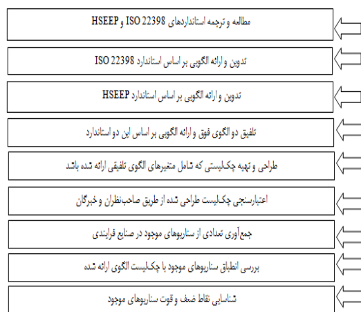
شکل ۱- مراحل انجام مطالعه

میزان انطباق سناریوهای مورد بررسی با زیربندهای مختلف الگوی پیشنهادی در جدول ۱ ارائه گردیده است. فراوانی انطباق و عدم انطباق سناریوهای مورد بررسی در قالب مراحل اصلی الگوی پیشنهادی نیز در شکل ۳ ارائه گردیده است. نتایج نشان داد در بین سناریوهای مورد بررسی فقط زیربندهای آماده‌سازی سناریو و اجرای مانور به‌صورت کامل در کلیه سناریوها لحاظ گردیده بود (۱۰۰ درصد منطبق). از بین زیربندهای مرحله ایجاد بستر و زیربنای مناسب، تعیین زمان پروژه، تعیین چارچوب ملزوم، گپ آنالیز و ارزیابی نیازها، تشکیل تیم طرح‌ریزی، جلب حمایت مدیریت، تعیین اهداف، مدیریت تیم طراحی، مدیریت ریسک و امنیت اطلاعات، جنبه‌های محیطی، جنسیت و تنوع، لحاظ کردن، لجستیک، تامین تست و ارتباطات، انتخاب نوع سناریو، تعیین روش مانور، تعیین قابلیت‌ها، وظایف و اهداف، تهیه برنامه تداخلی، آماده سازی سناریو، تهیه شرح سناریو، تامین سناریو، وسایل واقعی سازی سناریو، مستندات تهیه، جلسه توجیهی، مشارکت کنندگان، توجیه صحنه، تنظیم راه اندازی مانور، اجرای مانور، مشاهدات، ثبت، هات واژن، جلسه ارزیابیها و کنترلها، بررسیهای پس از مشاهده، تعیین روش ارزیابی، طرح‌ریزی، ارزیابی، انجام ارزیابی، جمع داده‌ها، تجزیه تحلیل داده‌ها، اقدامات اصلاحی، تهیه بازنگری مدیریت، های بهبود برنامه، پیگیری اجرا