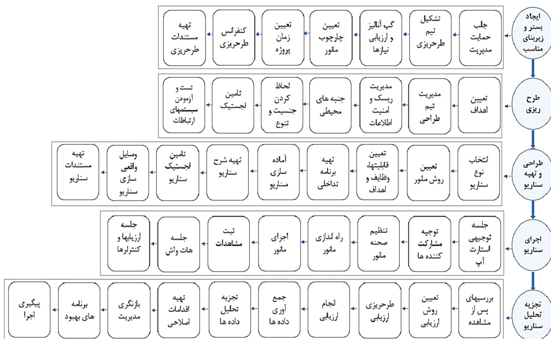
شکل ۲- مراحل الگوی پیشنهادی

نتایج حاصل از استخراج الگو از دو استاندارد مورد بررسی نشان داد که الگوی پیشنهادی شامل ۵ مرحله اصلی و ۴۱ زیربند می‌باشد. ۵ مرحله اصلی الگوی