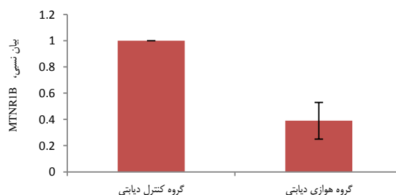
نمودار ۱- بیان نسبی MTNR1B در بافت پانکراس گروه‌های سالم و کنترل دیابتی

۳- بیان ژن MTNR1B در گروه‌های دیابتی به میزان معنی‌داری نسبت به گروه کنترل سالم افزایش یافت.