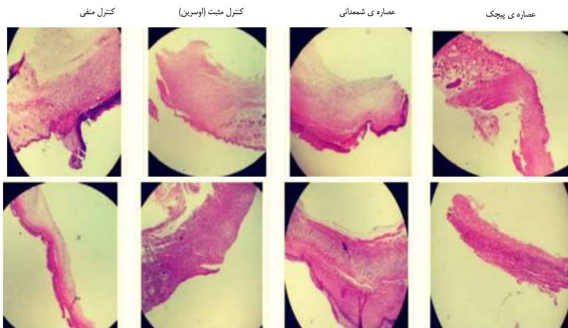
شکل ۲- بررسی هیستوپاتولوژی مقاطع زخم در روزهای دوم و چهاردهم در ۴ گروه مختلف و مشاهده‌ی فرآیند پیشرفت بهبود زخم با توجه به جدول ۲