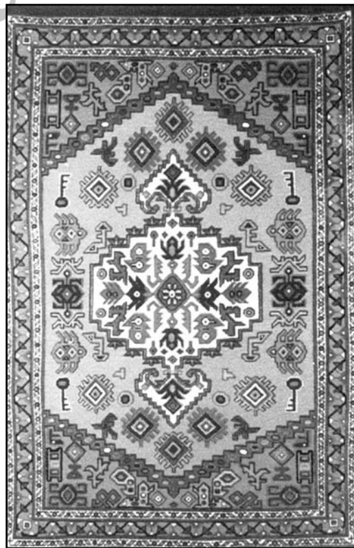
"هنر" - هنرهای سنتی ایران "هنر" - هنرهای سنتی ایران