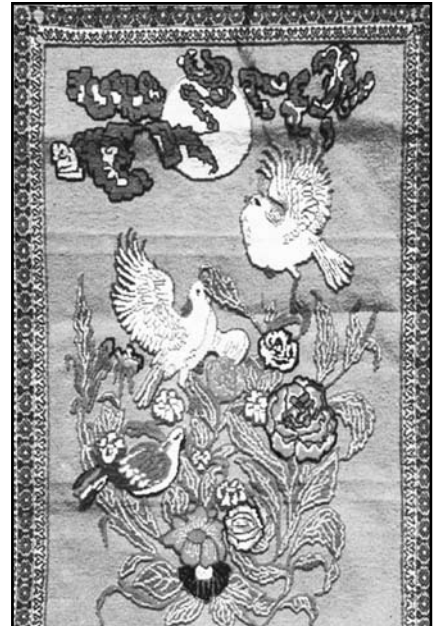
"fl " E ü " ü " :.éç