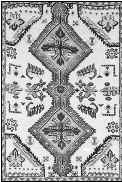
"fl E : è " : é