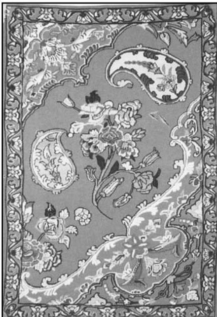
"fl " E ü " ü " :.éé