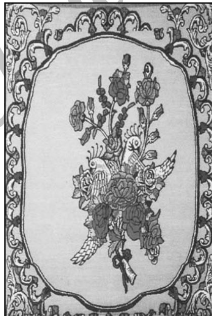
"fl " E ü " ü " :.éè