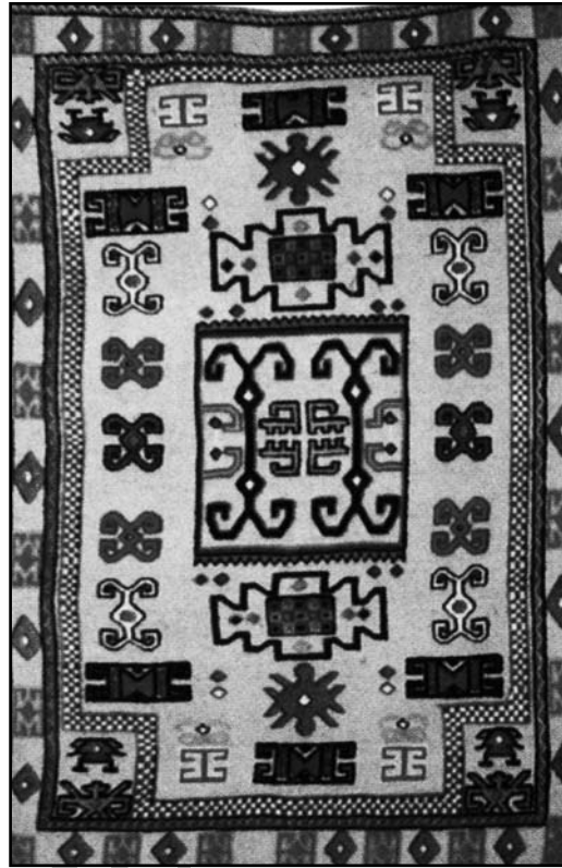
"هنر" - هنرهای سنتی ایران "هنر" - هنرهای سنتی ایران