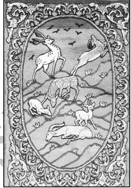
" ü :.éí