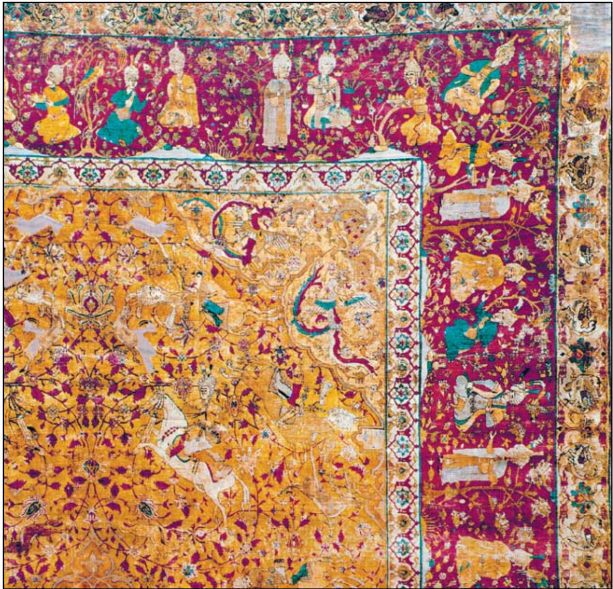
Figure 1. A detail from a medieval Islamic manuscript painting, showing a scene with figures and intricate floral patterns.

53 - M. Golfer. Jargensen Medieval Islamic Symbolism and the Paintings in the Cefalu Cathedral , Leiden: E. J. Brill, 1986, p.131.