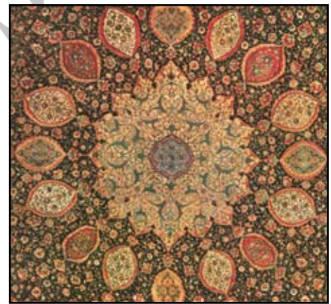
شکل ۱: فرش قاجاریه با طرح گل‌ساز و کتیبه در مرکز. این فرش از اصفهان است و در موزه فرش تهران نگهداری می‌شود.