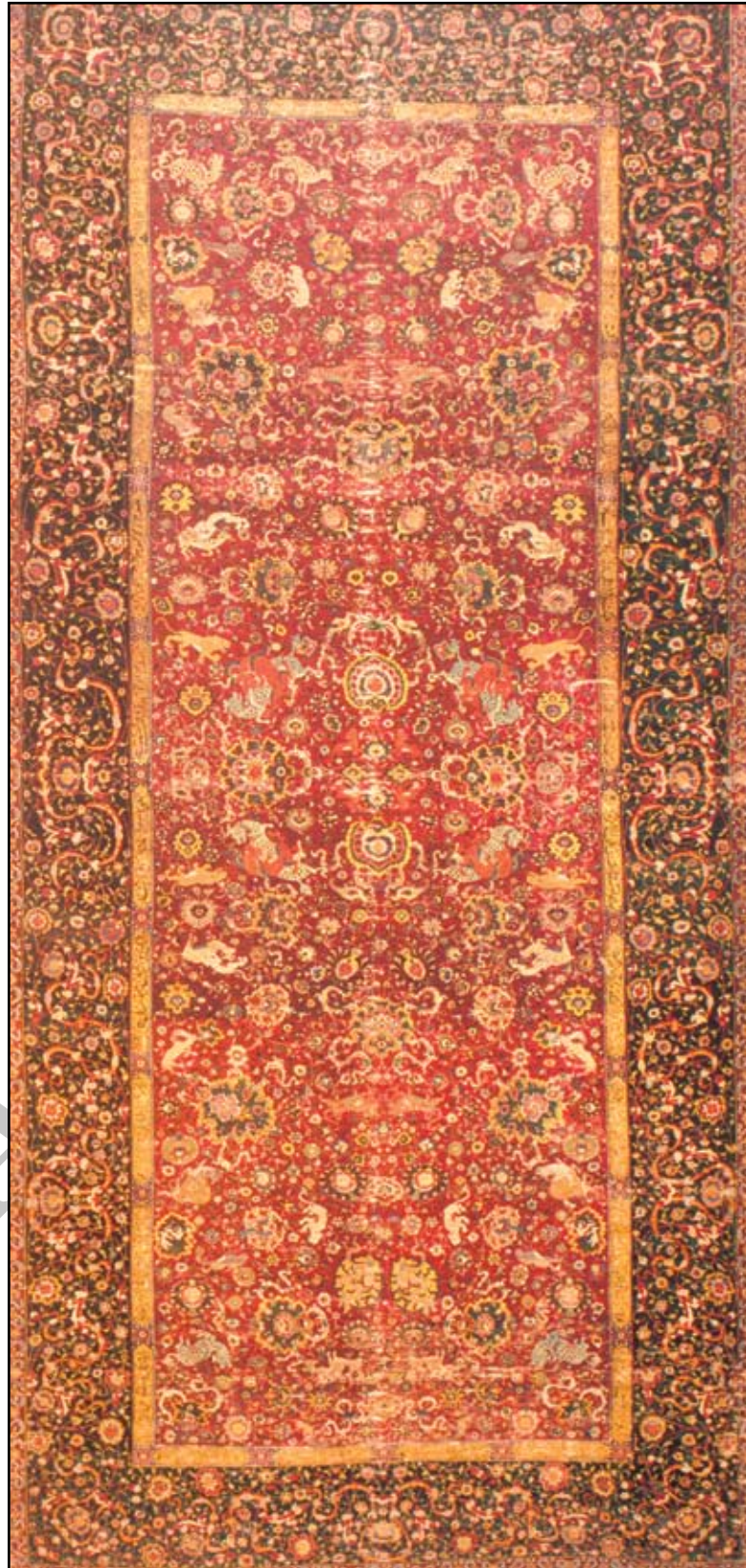
"عقبات سبز" فرش دستباف - فرش ماشینی - فرش صادراتی