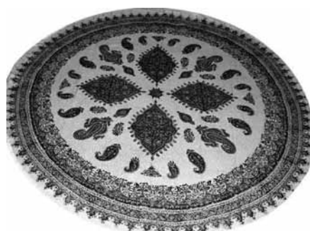
تصویر ۷- نمونه تمام شده کار قلمکاری.

اگر پرسند که: چهار پیر حقیقت کدام است؟ جواب بگو: اول، پدر دویم، معلم، سیم، استاد، چهار پدر عروس اگر پرسند که چهار پیر معرفت کدامند؟ جواب بگو که: اول، شیخ عطار، دویم خواجه حافظ شیرازی، سیم، شاه شمس تبریزی، چهارم، ملای روم.