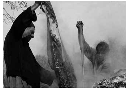
تصویر ۳- جوشاندن کرباس در بدیگک، مرحله ثابت کردن رنگ پارچه.

هنرمندان برای تهیه رنگ سیاه از زاج سیاه و برای تهیه رنگ قرمز از زاج سفید استفاده