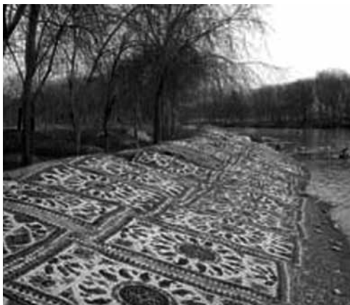
تصویر ۶- پهن کردن پارچه‌ها رو به آفتاب، مرحله سفیدگری.

می‌کنند. ۴۵ رنگ و نقش دو عنصر اصلی و مهمی در پارچه‌های قلمکار هستند که حس زیبایی و آرامش را به بیننده القا می‌کنند. برای تثبیت رنگ و زیبا تر شدن و از بین رفتن مواد زائد پارچه‌ها را شسته و در آفتاب پهن می‌کنند. (تصویر ۵) این کار در اصفهان که از مراکز اصلی قلمکاری است در کنار رودخانه زاینده رود انجام می‌گیرد دیدن اینگونه پارچه‌ها با نقوش متعدد و رنگ‌های متنوع در کنار رودخانه زاینده رود زیبایی را در چشم بیننده دو چندان می‌کند. (تصویر ۶)