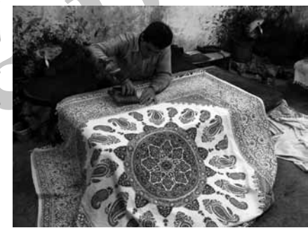
تصویر ۴- استاد چیت ساز در زمان کار بر پشت تخته.