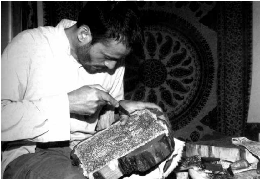
تصویر ۱- کندن نقوش بر روی چوب قالب توسط استاد کار.

در تصویر فوق (تصویر ۱) نیز استاد قلمکار در حال کندن نقوش گل و بته بر روی چوب است. در انتها نیز چوب های اضافی دور تا دور طرح ها را می برند و در پشت چوب، دسته ای برای قالب درست می کنند.