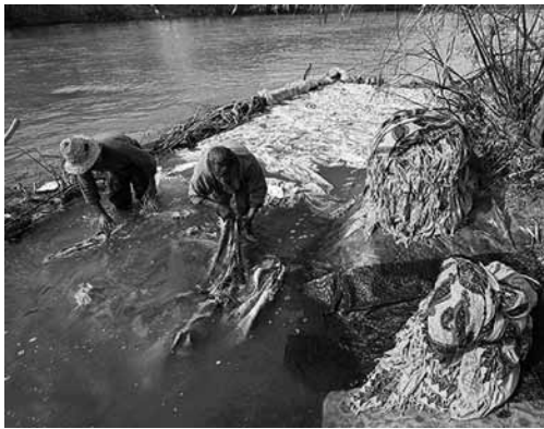
تصویر ۵- شستن پارچه‌های قلمکار جهت گرفتن مواد زائد و رنگ‌های اضافی.