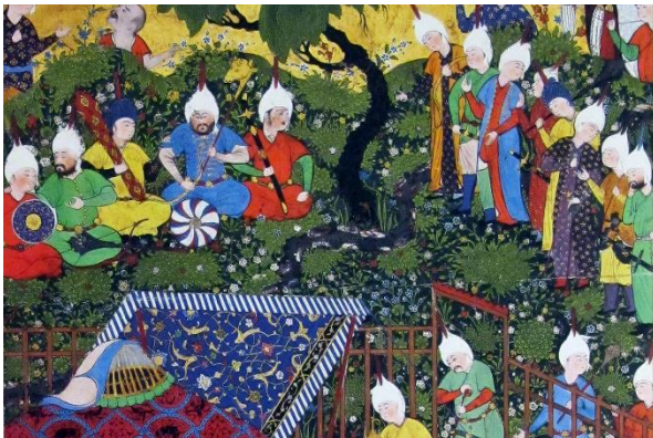
تصویر ۴: رای زدن فریدون با ایرج در کار سلم و تور (فردوسی، ۱۳۹۲: ۸۳)

از تصویر ۴ که رای زدن فریدون با ایرج ۶ و تصویر ۵ که آوردن پسر یکی از قیاصره روم به نزد تیمور را نمایش می‌دهد و نیز نظمی که خرگاه شهریار را برای «بزم خاص و مجلس زمرة اختصاص» وصف کرده است، می‌توان نتیجه گرفت که خرگاه مانند خیمه مدور بوده، اما برخلاف آن سری چنبرمانند و گنبدی داشته است: