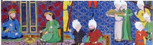
رده تکیه چو بر طارم چارمین آفتاب (یزدی،

وئاقی مدور بسان سپهر سپهری پر از ماه و ناهید و مهر درون و برونش مغرق به زر مرصع به یاقوت و در و گهر ز دیبا تتق بسته کرد اندرش پر از گوی عنبر سر و چنبرش یکی تخت زرین گوهرنگار نهادند در خرگاه شهریار زده تکیه صاحبقران کامیاب چو بر طارم چارمین آفتاب (یزدی، ج ۱، ۱۳۳۶: ۱۸۶)