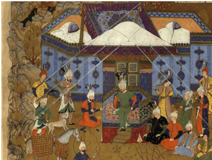
تصویر ۱: به عز سباط بوس رسیدن فرستادگان قیصر روم در جلگه سیواس (یزدی، ۹۳۵ق: ۵۹۴)

همچنین جمله «سراپرده عظمت و کامگاری با طناب دولت و بختیاری استوار کرده، به اوج سعادت برافراختند.» (یزدی، ج ۲، ۱۳۳۶: ۳۶) بیان می‌دارد که سراپرده را به کمک طناب‌هایی به زمین مهار می‌کردند. به علاوه، تصویر ۱، نگاره‌ای