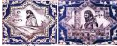
اردوان دوم فرهاد دوم