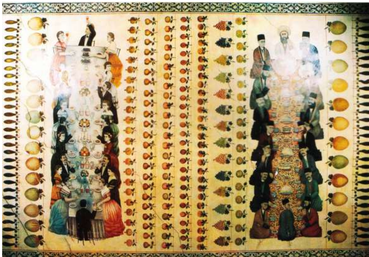
تصویر ۱: سفره ایرانی و فرنگی، نقاشی روی سقف، قصر سردار ماکویی، دوره قاجار

نقاشی از دو بخش کاملاً مجزا و هم اندازه تشکیل شده و فضای میانی با تصویر ردیف هایی از انواع میوه و سبزی پر شده است (تصویر ۱).