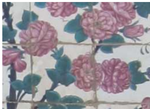
تصویر ۳، نمونه کاشی کاری ایوان مسجد وکیل