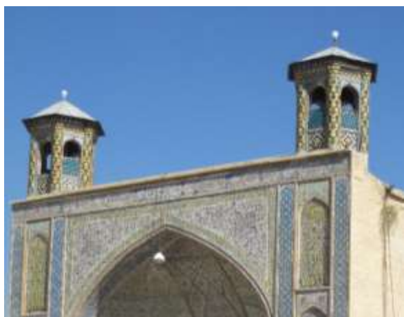
تصویر ۱۶، گلدسته های مسجد وکیل

گلدسته های مسجد وکیل در سمت شمال قرار دارد و با کاشی کاری های زیبا تزئین شده است. این گلدسته ها در سنت اسلامی در حد نمادپردازی، نمایشگر محور هستی آدمی است از آن بعد که در ظاهر انسان تنها وجودی است که بر روی دو پا به صورت عمودی می ایستد و راه می رود و از جنبه باطنی یادآور روح انسان است که در پی تعالی و توجه به عالم بالاست برای بازگشت به خاستگاه ازلی اش (تصویر ۱۶).