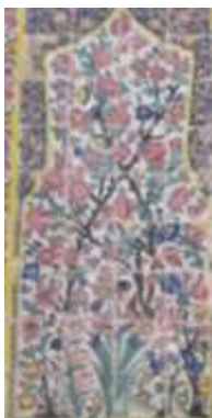
تصویر ۴، نمونه کاشی کاری محراب مسجد وکیل