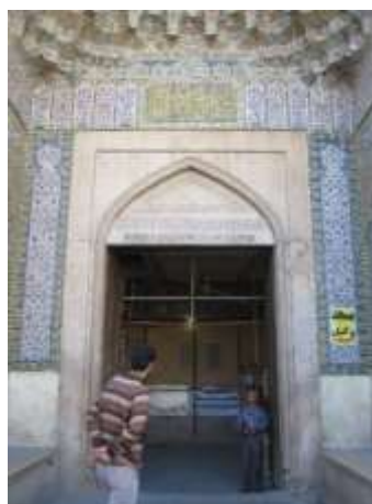
تصویر ۱۷، سردر ورودی مسجد وکیل

از آنجاکه گذر از هر مرحله همانند عبور از در است، از این رو می توان در را نماد گذر دانست و به دلیل این ویژگی نمادین در که عبور از ناپاکی ها و ورود به مکانی پاک است، آداب ورود به این حریم نیز نمادین است و معمولاً عبور از در با یاد خدا آغاز می شود. لذا ورود به مسجد نیز که بالاترین مکانهاست آداب خاصی دارد و ورود به آن باید با پای راست باشد چراکه جایگاه فرشته نیکی ها در طرف راست است.