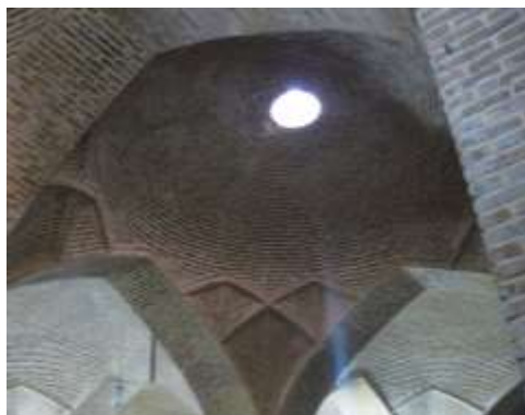
تصویر ۱۲، هورنو های تعبیه شده در شبستان شرقی مسجد وکیل

به کاررفته است، باین حال کاربرد آن برای هنرمندان متفاوت است. «هنرمندان مسلمان به خوبی می‌دانند که نور را چگونه جذب کنند و به هزاران طریق مختلف درخشان و مشعشع سازند.» (بورکهارت، ۱۳۸۶، ۱۱۴). یکی از نکاتی که توسط معماران ایرانی مورد توجه قرار گرفت، توجه به نور است. می‌توان به تبیین و توصیف این نماد عرفانی (نور) در مسجد وکیل پرداخت و با استفاده از بیان و روایت، مدلول را برای خواننده آشکار کرد. شخصی که در این مسجد وارد می‌شود در جای جای این فضا، ضمن تحت تأثیر قرار گرفتن از نحوه نورپردازی داخل بنا، حضور خداوند را متوجه می‌شود و این دلیلی است بر آن که به واسطه هنر طراحی فضا توسط معمار به صورتی که در آن با تغییرات تناسبات فضا و نور و رنگ و سایر عناصر دخیل در فضایی معماری، علاوه بر ایجاد روشنایی کافی، احساس معنویت، فضایی روحانی و نیل به ملکوت را در بازدیدکننده تحریک می‌کند. در شبستان شرقی مسجد وکیل برای نور رسانی، هورنو ۱۰ هایی در سقف تعبیه شده است که با ایجاد فضایی ابهام‌آور، نمازگزار را به تفکر و تمرکز وامی‌دارد (تصویر ۱۲).