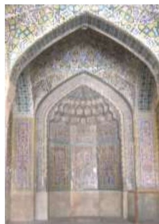
تصویر ۱۵، محراب مسجد وکیل

منبر از دیگر عناصر نمادین مساجد است. منبر مسجد وکیل که در شبستان جنوبی قرار دارد یکی از نمونه های بارز این نماد است. در مورد معانی نمادین این منبر می توان گفت: «شکل نمادی منبر نشانه تقدس شخصیتی بود که در زیر آن می نشست و شکل نمادی پله ها به مفهوم نردبان جهان است که از مراحل دنیوی و روحانی می گذرد و به روح مطلق می انجامد. واعظ و خطیب به هنگام بالا رفتن از منبر، در واقع ارتباط از مادیات و زمین می کند و به ملکوت اعلی عروج می نمود» (زرگر، ۱۳۸۶، ۵۲). (تصویر ۱۷)