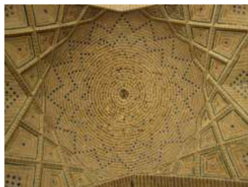
تصویر ۱۳، آجرکاری‌های مسجد وکیل

۲-۳- نمادهای ساختاری: مانند «محراب»، «گلدسته»، «منبر»، «سردر ورودی» و امثال آن‌ها هستند که در تمام هنرهای اسلامی با تفسیرهایی نزدیک به هم به کار می‌رود؛ ولی در مقایسه با دسته اول هم جزء لاینفک مساجد هستند، هم دارای تفاوت‌های دلالتی گسترده‌تری هستند. به‌عنوان نمونه محراب مسجد وکیل است که به‌عنوان یک شاهکار هنری در شبستان جنوبی مسجد قرار داشته و این محراب با کاشی‌کاری هفت‌رنگ و تصاویر گل‌وبوته تزیین شده و سقف آن مقرنس‌کاری شده است. این نماد به‌عنوان عنصر داخلی مسجد با بهره‌گیری از رنگ‌های خاص وحدت و یگانگی خداوند را به تصویر می‌کشد. محراب تقریباً در تمامی ادیان به‌عنوان جایگاه تجلیات وجود دارد؛ این امر یک نماد اصیل اسلامی است و همان‌طور که بیان شد ریشه در نص قرآن دارد. محراب محلی برای درخشش پرتو الهی و دروازه‌ای به سوی بهشت است که این حس و مفهوم از قوسی شکل بودن محراب و آیات سوره قرآن در دورتادور آن به عیان آشکار است (سجادی، ۱۳۷۷، ۱۲-۲).