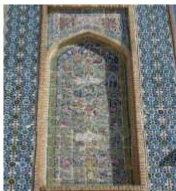
تصویر ۱۴، رنگ‌بندی متنوع در کاشی‌کاری مسجد وکیل

استفاده از چندین رنگ در کاشی‌کاری مسجد وکیل که نظر هر بیننده‌ای را به خود جلب می‌کند نیز رمز و نماد غنای آفرینش و دیگر جنبه روح پیامبر اکرم (ص) است که تجلی و بازتاب غنای پایان‌ناپذیر خزائن الهی است که هر لحظه در کار خلق است و امکانات بی‌پایان آن هرگز نقصان نمی‌پذیرد (تصویر ۱۴).