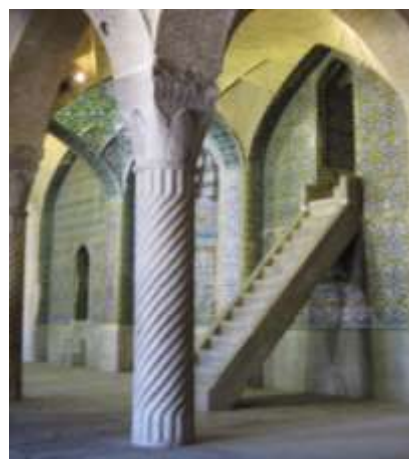
تصویر ۱۶، منبر مسجد وکیل

وقتی نمادهای عرفانی و نمادهای ساختاری در کار هنرمند دلالت های تازه تری را آشکار سازد، نشان دهنده این موضوع است که عمل سازنده آن برگرفته از اندیشه ها و تجربه های عرفانی - هنری وی است، نه تقلید از هنرمندان