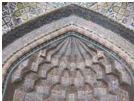
تصویر ۱۰، مقرنس کاری محراب مسجد وکیل

بررسی نشانه‌های اسلامی تنها به نقوش اسلامی اختصاص ندارند. حتی آداب و رسوم هم که مسلمانان انجام می‌دهند، می‌تواند نوعی نشانه باشد. به‌عنوان نمونه آیین نماز نشانه‌ها شدن روح و پیوستن به معبود است. هنگامی که به نماز می‌ایستیم هزاران مفهوم و معنا را با معبود خود مرور می‌کنیم. تکبیره الاحرام می‌گوییم و به وحدانیت آن ذات بی‌شریک اعتراف می‌کنیم. قنوت می‌بندیم، دست‌ها و انگشتان خود را به سوی بالا می‌بریم و بر صفات جمالیه و جلالیه آن بزرگ گواهی می‌دهیم. به‌واسطه این اقامه نماز، سعی در تزکیه نفس و اخلاق می‌کنیم. جسم خود را از آلودگی‌های جسمانی و روح خود را از آلودگی‌های روحی می‌زداییم. همچنین دیگر بخش‌های آیین‌های اسلامی، هر کدام نشانه‌های قابل تأویل محسوب می‌شوند (مصدری، ۱۳۸۵، ۱۰).