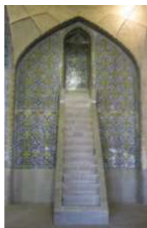
تصویر ۹، کتیبه‌نگاری منبر مسجد وکیل

بر اساس آنچه پیش‌تر در مورد تعریف پیرس از فرآیند نشانگی آورده شد می‌توان گفت، کتیبه‌ها به این علت جزء نشانه‌های نمایه‌ای می‌توانند قرار بگیرند که بازمودی هستند که دلالتشان به موضوعشان، نه از طریق قیاس و نه به دلیل پیوند آن با ویژگی‌های عامی که موضوع آن ممکن است داشته باشد، بلکه به دلیل ارتباط پویا و همچنین فضایی است که از یک سو با موضوع دارند و از سوی دیگر به افراد و واحدهای منفرد دلالت می‌کنند.