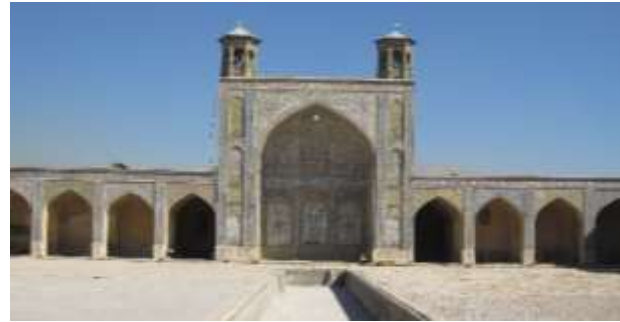
تصویر ۱، مسجد وکیل شیراز تصویر ۲، پرسپکتیو مسجد وکیل