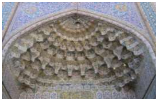
تصویر ۱۱، مقرنس کاری سردر ورودی مسجد وکیل

آن‌ها (نمایه‌ها) توجه را از طریق نوعی اجبار کور به موضوع‌های شان جلب می‌کنند؛ جزء نشانه‌های نمایه‌ای به‌حساب می‌آیند ولی کیفیت نشانه‌های نمادین را هم دارند.