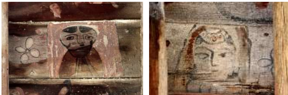
تصویر ۲: چهره زنان- بنای خداوردی

و همین‌طور ورود زن به عرصه دیده شدن دانست. تعاملات زنان ایرانی با زنان خارجی در دوره قاجار که مفهوم آزادی زن را برای ایشان ملموس ساخت، با گریز از تفکر بسته زندانی ماندن در حصار خانه و بچه‌داری، می‌تواند عواملی باشد تا هنرمندان و نخبگان به نیاز حضور زن در عرصه‌های اجتماعی بپردازند و زن در بسیاری از مناسبات اجتماعی فرهنگی و هنری جلوه‌گر شده، تغییر وضعیت داده و دیده شود.