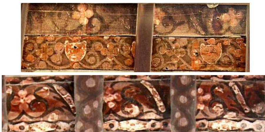
تصویر ۲۰: نقش گیاهی (ختایی و اسلیمی)

زیبایی و شکوه تذهیب‌گونه‌ای در اغلب شیرسرهای بناهای تاریخی گرگان ایجاد شده و در ترکیب با خوشنویسی‌ها و نقاشی‌ها چشمگیر است اما از دور، زیرا از نزدیک و با دقت که به آن‌ها می‌نگریم در می‌یابیم که نظم آن‌ها بدوی است؛ چنان بی‌نظم و خام‌دست هستند که اگر شخصی برای نمونه بخواهد از روی آن‌ها نسخه‌برداری کند هیچ‌گاه به نتیجه مطلوب نمی‌رسد. نگاره‌ها به دو دسته؛ گاه به صورت اسلیمی بر روی قوس حلزونی (بند اسلیمی) و در مواردی بر این حرکت، گل و برگ قرار گرفته و طرح ختایی را به وجود آورده‌اند. طرح‌های اسلیمی ساده‌اند و طرح‌های ختایی با گل‌هایی در قالب دایره و گل‌هایی هشت‌پر، شش‌پر و پنج‌پر طراحی شده‌اند. ترکیب برگ در طرح‌های ختایی ساده و کوچک و یا برگ‌های کنگره‌دار (لوتوس) است.