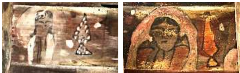
تصویر ۱۹: نقش اشیا- بنای خداوردی

در بین نگاره‌ها، اشیائی به تصویر کشیده شده‌اند که هم جنبه تزئینی و هم نقش وسیله‌ای کاربردی دارند. هنرمند از شیء نمادین؛ سرمه‌دان و یا آینه که مرتبط با زنان بوده؛ در چند مورد مقابل تصویر زنان ترسیم کرده که نمایانگر ابزار بزرگ و آرایش زنانه است. در مورد این نماد به‌طور عموم و به‌ویژه در خاور دور تصور می‌رفت که آینه دارای خواص جادویی است و با تصور، آینه می‌توانست ارواح خبیث را از این جهان و در جهان دیگر دور کند (هال، ۱۳۸۰: ۴) و این مطلب با توجه به این‌که مردم عامی اعتقاد به نوشته و نقش پشت آینه دارند قابل بررسی است.