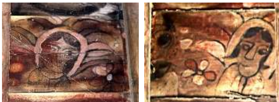
تصویر ۱۰: چهره ایزدبانوان - بنای خداوردی

از سویی آناهیتا مظهر عشق و ملاحظت و جمال است؛ کهن‌الگوی باستانی، معشوق شعری ما ایرانیان است (مظفری، ۱۳۸۱: ۸۳) و این صفت آناهیتا از لحاظ عاطفه و عشق؛ عشقی که موجب تشکیل خانواده می‌شود، همواره در مفهوم خود خصایص زن است و در هر دوره پیشاهنگ این دو خصیصه است. برداشت دیگری که از نگاره‌ها می‌توان داشت این‌که هنرمند با این روش خواسته جلال و حریمی والا برای زنان جامعه خود قائل شده، نگاهی مقدس و الوهی به آنان داشته و بخشیده باشد.