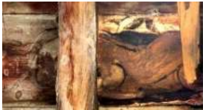
تصویر ۱۷: نقش شیر و خورشید - بنای خداوردی

تصویر ۱۷، تنها نمونه‌ای است که از نظر نگارندگان به نقش «شیر و خورشید» نزدیک است. پیکره لمیده حیوانی با دم کشیده، سر این حیوان زیر شیرسر پنهان شده و نیم دایره خورشید با شعاع‌های مثلثی شکل که در پشت حیوان قرار گرفته است. نقشی که در آن زمان نماد ملی و رسمی ایران بوده، در نگاره‌های سقانفار ۷ های مازندران دیده شده و با توجه به همزمانی اجرای این آثار، هم‌جوار بودن این دو منطقه و تبادلات فرهنگی و سینه‌به‌سینه مردمان، بر نقش شیر و خورشید بودن این اثر صحت می‌گذارد.