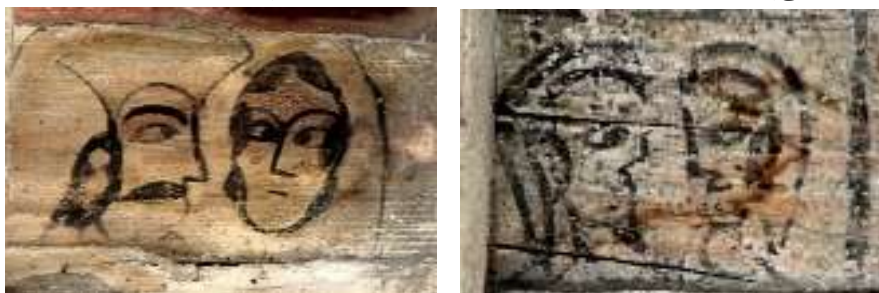
تصویر ۴: تلفیق چهره زن و مرد- تصویر سمت راست: بنای پیرتکیه، تصویر سمت چپ: بنای خداوردی

تقابل و قرارگیری نقش زنان و مردان در این آثار (تصویر ۴) می‌تواند جامعه‌ای را تصور کند که اقتدار سیاسی، اجتماعی با مردان است؛ جامعه مردسالارانه که حق مالکیت، قضاوت و پیشوایی دین به عهده مردان است اما در عین حال زن هنوز در مرکز کانون خانواده قرار دارد و شریک اموال مرد است. از گونه دیگر، ترکیب زن و مرد، روابط عاشقانه‌ای است که ریشه در قصه‌ها داشته و یا می‌تواند نوعی از روابط زناشویی و نمایش نیک‌بختی دو زوج باشد. استدلال دیگر از این ترکیب، به رابطه اساسی زن و مرد در توالد، تناسل و یا زایش می‌پردازد؛ رابطه‌ای که بنیان‌گذار بقا در جهان و سرچشمه باروری است.