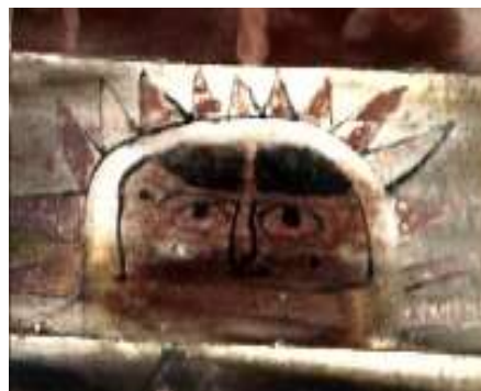
تصویر ۱۶: خورشید- بنای خداوردی

عنوان مقاله: خاستگاه شناختی، طبقه بندی و تحلیل نقش های شیرسر بناهای قاجاری گرگان