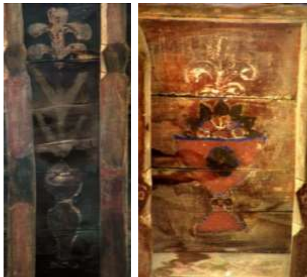
تصویر ۲۱: نقش گلدانی- بنای حاج قاسمی

تنها گل استفاده شده در این گلدان‌ها زنبق است با ساقه‌ای بلند، برگ‌هایی دراز و کشیده و گاهی با ساقه‌ای کوتاه که لبه گلدان‌ها از گل و برگ‌ها پوشیده شده است. تنوع رنگ‌گذاری به صورت سطوح رنگی تخت در این بخش بیش‌تر دیده می‌شود.