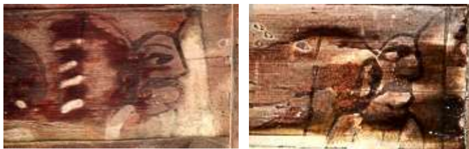
تصویر ۱۱: ایزدان- بنای خداوردی

ایزد [تیشتر] نگهبان باران و فرشته روزی و رزق است که از وجود او، زمین پاک از باران‌های به‌موقع برخوردار می‌شود و کشتزارها سیراب می‌گردند (یاحقی، ۱۳۸۸: ۲۶۱). تیشتر، نیروی نیکوکاری است و در نبردی کیهانی با آپوشه یا آپوش، دیو خشک‌سالی و تباه‌کننده زندگی است، درگیر می‌شود (هینلز، ۱۳۷۷: ۳۶-۳۷) و سرانجام او را شکست داده و آب‌های آسمانی را بر زمین فرو می‌ریزد. به هر حال اسطوره تیشتر نشان می‌دهد که ایرانیان از دیرباز به نبرد خوبی و بدی می‌اندیشیده‌اند و برای مبارزه با کم‌آبی و خشک‌سالی، اسطوره نبرد تیشتر و آپوش دیو را پروراندند تا به‌نوعی ستایشگر ایزد- ستاره باران باشند (اسماعیل پور مطلق، ۱۳۸۱: ۹۳). تیشتر ایزدی است، پدید آورنده فرزندان از مردمان (هینلز، ۱۳۷۷: ۷۷) و با قرار گرفتنش در میان ایزدبانوها و زنان، اصل توالد، تناسل و زایش تصویر می‌شود و با باران‌آوری که همه ساله تکرار می‌شود به زندگی گیاهان و جانوران و مردمان این مرز و بوم جانی دوباره می‌بخشد.