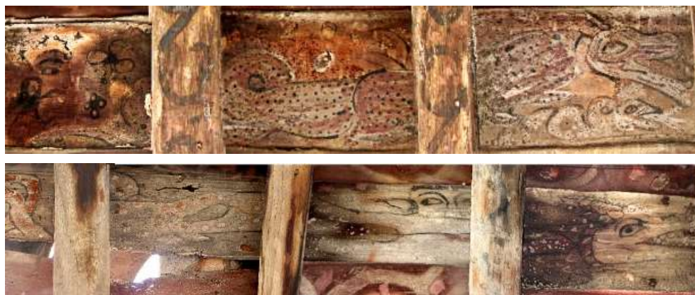
تصویر ۱۵: اژدها-مار- بنای خداوردی

در چند نمونه نقش شده بر سقف خانه خداوردی، تصویر اژدها، برگرفته از شکل مار؛ مارهای عظیم‌الجثه خزنده دیده می‌شود که اصطلاح اژدها-مار مناسب این نگاره است. سر این گونه اژدها، همچون سر گرگ است. پوزه‌ای دراز، دهانی باز که در بعضی، دندان‌شان از دهان بیرون زده و شعله آتشی از آن می‌جهد. در مواردی، از فراز سر اژدها مارها، شاخ و برگ‌گی خارج شده که نماد جوانه زدن است (گربران، ۱۳۷۷: ۱۲۸) و تنه دراز، نرم و به هم پیچیده دارند. با مشاهده این نگاره‌ها در حالی که تصاویری از زن و ایزدبانو در پس آن‌ها دیده می‌شود، به نوعی ارتباط بین این دو نقش می‌توان اشاره کرد؛ مبنی بر باروری و زایش، اژدها نماد آب آسمانی و بارور کننده زمین است او موکل صاعقه است (گربران، ۱۳۷۷: ۱۲۸) و هم این‌که این نوع ترکیب در نگاره، اشاره به عنوان شوهر زن را دارد؛ میرچا در کتاب خود عنوان می‌کند؛ اژدها-مار در ابرها و دریاچه‌ها خانه دارد و موکل صاعقه است، آب‌های آسمانی را به سوی زمین سرازیر می‌کند و موجب باروری کشت و بارگیری زنان می‌شود (۱۳۷۲). از طرفی، این نوع ترکیب، با توجه به بیتی که منسوب به فروسی است: زن و اژدها هر دو در خاک به / جهان پاک ازین هر دو ناپاک به؛ نگرش جامعه مردسالار به زنان در مورد زن‌ستیزی قابل تأمل و بررسی باشد.