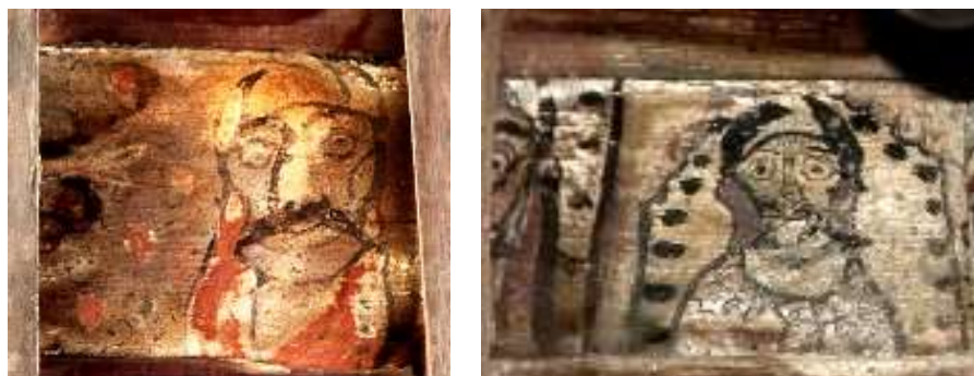
تصویر ۱۲: مردان اهریمنی، سمت راست: پیرنکیه و سمت چپ: خانه خداوردی

گونه دیگر، چهره‌های کریه نقش شده بر زیر سقف‌ها را می‌توان تعمیم داد به دیو قحطی و خشک‌سالی، پوش در برابر ایزد باران که اصل خیر بوده است. تفسیر دیگر از تصویر شدن مردان اهورایی در کنار مردان اهریمنی سمبلی دیگر از تضاد دوگانگی درونی و نفسانی انسانی است، یعنی نیمه شیطانی با صفات نکوهیده و عادات زشت و غلط به‌عنوان دیو و نیمه الهی که به خصایص نیک و پاک آدمی اشاره دارد و به‌عنوان ایزد یاد می‌شوند و درنهایت جمع این دو ضد، قالب انسان را می‌سازد.