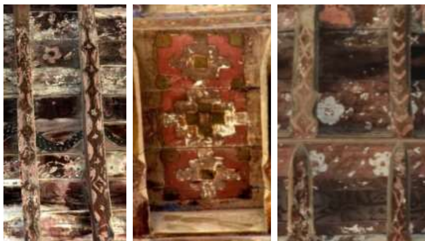
تصویر ۲۵: نقش هندسی

بین آنها ختایی ساده دیده می‌شود، خطوط مورب موجی، خطوط متقاطع که ایجاد نوارهای زنجیره‌ایی به شکل لوزی‌های ممتد کرده‌اند، تقسیمات هندسی مربع که برگرفته از نقوش بنایی در تزئینات معماری است.