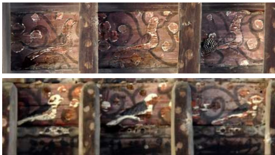
تصویر ۲۲: گل و مرغ- بنای مفتاح

گل‌های چهارپر و هشت‌پر که چکیده‌نگاری شده‌اند و بر قوس حلزونی (بند اسلیمی) استوار هستند.