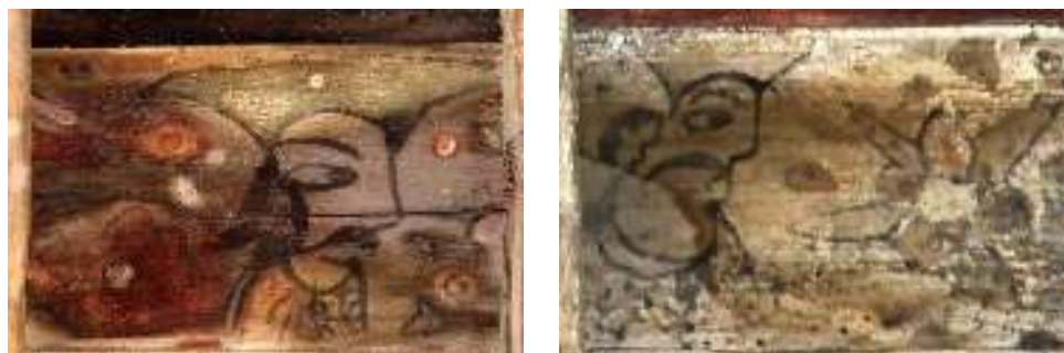
تصویر ۳: چهره مردان- بنای خداوردی

بررسی‌ها نشان داد، از روی ظاهر تصویر مردان موجود در شیرسرها نمی‌توان به هویت حقیقی آن‌ها پی برد. این تصاویر معمولاً به صورت فرم چهره‌هایی در قالب یک نقش و بدون توجه به سن و سال آن‌ها ترسیم شده‌اند (تصویر ۳). نکته دیگر این‌که هیچ‌کدام از نگاره‌های مردان ریش ندارند اما همه نمونه‌ها، دارای سبیل بلند که نماد قدرت مردانه است؛ در جامعه‌ای که نگرش و شیوه حکومت پدرسالارانه بوده و بازتاب آن در حوزه اجتماعی جامعه، به‌ویژه در برخورد با زنان انعکاس یافته بود. چهره نیم‌رخ مردان با ترسیم چشمان از روبرو که گویی چشم به زنان دوخته‌اند، شاید نمودی عینی از مورد تأیید قرار گرفتن زنان آن جامعه پدرسالار؛ چه از دید زیبایی ظاهری و چه از منظر اجتماعی است. همین‌طور، از نحوه ترسیم نیم‌رخ و رو به زن مردان، گمان بر تماشایی بودنشان بر قدرت زن در کار، تولید، زایش و غیره می‌رود. لورا مالوی (۱۹۸۹)، نقش زنان و مردان را در هنرهای بصری چنین تشریح می‌نماید: زنان به‌عنوان عاملی که در معرض دیده شدن قرار می‌گیرند و مردان به‌عنوان دیدار پردازان فعال شناخته شده‌اند.