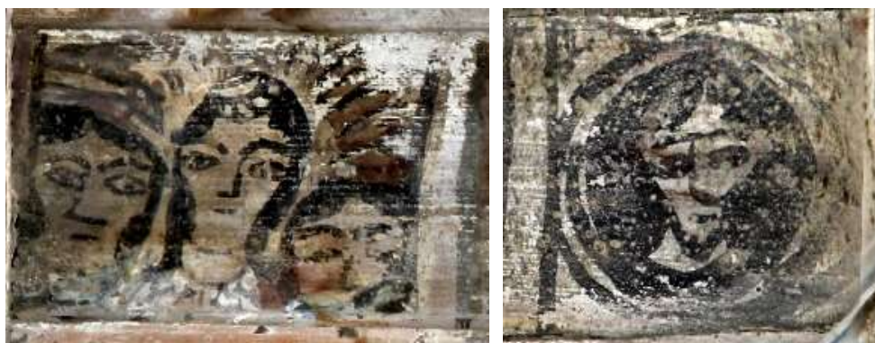
تصویر ۱: تصاویر انسانی متأثر از عکاسی - بنای پیرتکیه

بخش نسبتاً وسیعی از موضوعات به نقوش انسانی اختصاص دارد و با بررسی این نگاره‌ها، می‌توان چنین نتیجه گرفت که تأثیرات اجتماعی و نوع و نگرش زندگی مردم به‌ویژه زنان، به‌عنوان بخشی مهم از جامعه روزگار قاجار، در شیوه و سبک نقاشی شیرسر بناهای این دوره انعکاس یافته است. چهره‌هایی که نمایانگر هم‌آمیزی سنت‌های ایرانی و اروپایی در یک قالب پالایش یافته و شکوهمند است (پاکباز، ۱۳۸۵: ۱۵۱). از دیگر سو در نگاره‌های انسانی تأثیر عکاسی بر چهره‌نگاری‌ها دیده می‌شود (تصویر ۱)، تصاویری که به نگرنده زل زده‌اند، همان کاری که در هنگام عکاسی و در آثار عکاسی آن زمان دیده می‌شود. با مشاهده ژست و نحوه کادربندی موضوعات که به صورت آلبوم عکس بر چوب نقش بسته‌اند و در مواردی بیش‌تر به یک قاب عکس شباهت دارند، این گمان برای نگارندگان پیش آمد که شاید هنرمند عامی در ترسیم این آثار از عکس استفاده کرده باشد که این شیوه ترسیم شدن متأثر از فن عکاسی و عکس‌های روزنامه‌نگارانه، تصاویر چاپ و محصولات وارداتی غرب بوده است (ابراهیمی‌ناغانی، ۱۳۸۸: ۲۲).