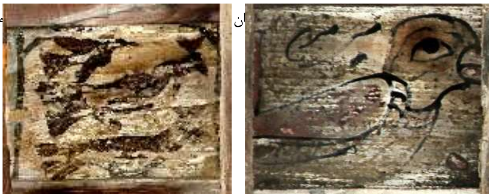
تصویر ۷: نقش پرنده-سمت راست: بنای خداوردی، سمت چپ: بنای پیرتکیه

در بین نگاره‌های خانه مفتاح، هم‌نشینی بلبل و کبوتر در بین نقوش گیاهی (ختایی و اسلیمی) مشاهده می‌شود (تصویر ۲۲). گیاه، نماد رشد و حاصلخیزی و پرنده نیز همان‌طور که گفته شد نماد ابر و باران است و این دو نشانه، در کنار هم مفهومی از حیات هستند. از نگاهی دیگر شاید هنرمند با نقش کردن فضا، به شیوه گل و مرغ به نوعی خواسته وضعیت حس نه