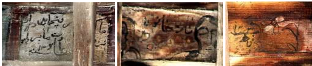
تصویر ۲۴: کتیبه- بنای خداوردی و پیرتیکه (منیم: نگارندگان)

آنچه در این تحقیق مدنظر است کتیبه‌هایی است که در میان نقاشی‌ها، به خطی ساده و به رنگ سیاه تحریر شده‌اند و جنبه کاربردی دارند. این نوشته‌ها مربوط به هنرمند نقاش است که در میان نگاره‌ها دیده می‌شود؛ همچون امضای نقاش، ثبت تاریخ اجرای اثر و همین‌طور نام بعضی از موضوعات در کنارشان نگارش شده است.