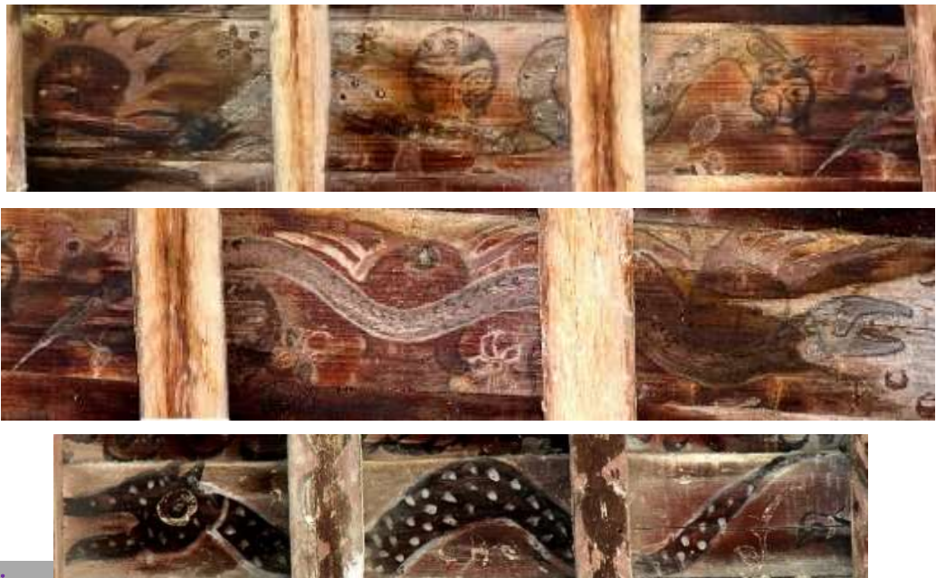
پیرسز بناهای قاجاری گرگان

در میان نقوش خانه دروکی (تصویر ۱۴)، تصویر تکرار شونده مار که با حرکتی موجی شکل بدن که موج آب را تداعی کرده و نشانگر همبستگی‌اش با برکت، بارندگی و پاییدن آب است. جهت حرکت این مارها در قالب نواری افقی که رودی خروشان را تداعی می‌کند، کل سطح زیر سقف را می‌پیماید. بدن این مار با شاخی که بر فراز سر دارد، نماد و حافظ آب است. شاخ، خود سمبل و نمادی از هلال ماه است و ماه که حرکاتش سبب جزر و مد آب‌هاست، در فرهنگ‌های مختلف همواره با آب پیوند دارد (رحیم‌زاده، ۱۳۸۲: ۲۲۵).