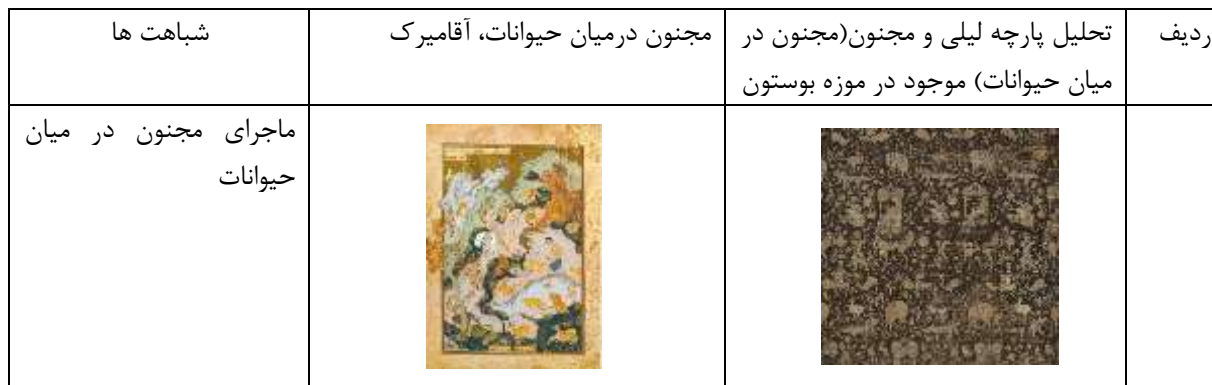
جدول شماره ۱ - شباهت‌های پارچه و نگاره (نگارنده، ۱۳۹۶)

عنوان مقاله: بررسی تطبیقی داستان نگاره مجنون در میان ددان خمسه طهماسبی با نگاره پارچه مضبوط در موزه بوستون به شماره ثبت ۱۹۲۸،۲، بر اساس نظریه بینامتنیت