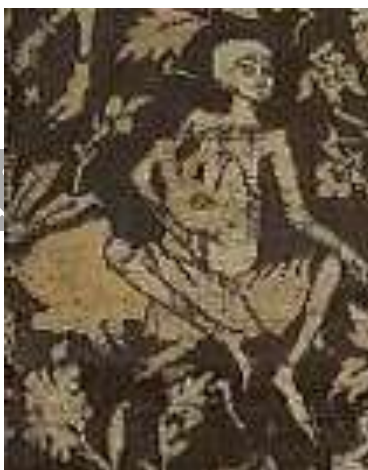
بوستون به بینامتنیت

مجنون از میان همه حیواناتی که گرداگردش بوده، آهوان را بیشتر دوست می داشت و از میان همه آهوان، به یک آهوی چالاک بیشتر محبت می کرد. هر روز او را کنار خود می خواند و دست نوازش بر سرش می کشید.