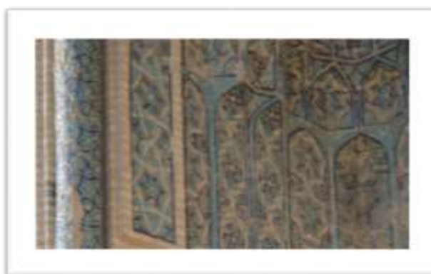
تصویر ۹: شمسه هشت پر با آجر معقلی در سردر شمالی مسجد، (ب) شمسه پنج پر در زیر نمای ایوان جنوبی مسجد جامع ورامین

شمسه نماد کثرت در وحدت و وحدت در کثرت است. کثرت تجلی صفات خداوند است که در این نقش به صورت اشکال کثیر ظهور کرده است که از مزکزی واحد ساطع شده اند. این نقش چنان که از نام آن پیداست مفهوم نور را تداعی می کند. بنابراین