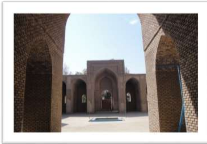
تصویر ۷: ایوان شرقی مسجد جامع ورامین