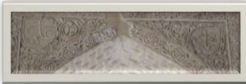
تصویر ۱۶: کتیبه با نام محمد (ص) و علی (ع) (منبع: نگارندگان)

تصویر ۱۵: کتیبه با نام الله (منبع: نگارندگان)