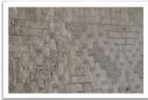
تصویر ۱۳: آجرهای مهری با نقش ماهی ی گیاهی در دیوار گنبد خانه به

نقوش گیاهی آراسته شده است (تصویر ۱۲). علاوه بر این از آجرهای مهری با نقش ماهی ی گیاهی در دیوار گنبد خانه به شکل مورب (تصویر ۱۳) تا زیر کتیبه سر تاسری با مضمون آیات سوره ی جمعه تکرار شده اند.