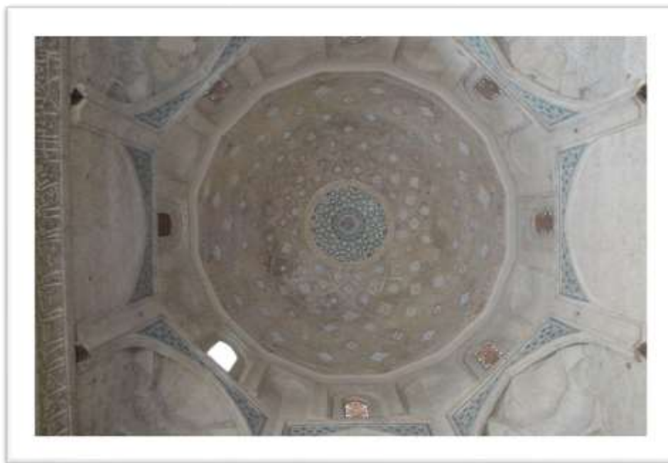
تصویر ۶: تزئینات گنبد خانه مقصوره

ایوان غربی، ایوان شرقی و ورودی غربی مسجد کم ارتفاع و دارای آرایه های کمتری است (تصویر ۷). در سفر نامه دیولافوا به پوسته مینایی خارج گنبد مسجد اشاره شده که در حال حاضر اثری از آن مشاهده نمی شود (دیولافوا، ۱۳۹۰: ۱۶۴). از نمونه های مساجد شاخص که قابل مقایسه با مسجد ورامین است می توان مسجد جامع زواره را نام برد (ویلبر، ۱۳۶۵: ۱۷۰).