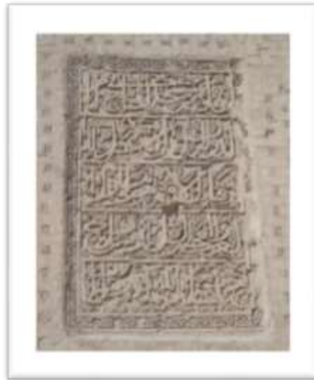
تصویر ۲: کتیبه ایوان جنوبی مسجد جامع ورامین

کتیبه سر در مسجد تاریخ ۷۲۲ و کتیبه زیر گنبد سال ۷۶۵ ه.ق را نشان می دهد (کیانی، ۱۳۶۸: ۲۳۷). مسجد در زمان الجایتو به بنایی حکومتی که تحت تاثیر تفکرات شیعی حاکمان بود تبدیل شد. این مسجد در گذر زمان از گزند حوادث روزگار مصون نبوده و بارها تخریب شده و دوباره مرمت شده است، از جمله در کتیبه ای در ایوان جنوبی شرح تعمیرات شاهرخ تیموری آورده شده است (تصویر ۲).