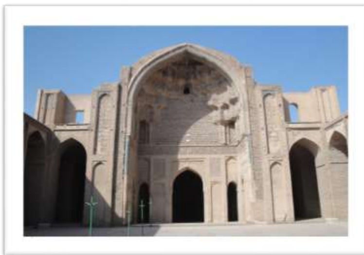
تصویر ۵: ایوان جنوبی مسجد جامع ورامین.

ایوان مرتفع جنوبی (تصویر ۵) و گنبد خانه ی مقصوره پشت آن محور شمالی- جنوبی قدرتمندی را ایجاد کرده است که ضمن تاکید بر جهت قبله بیشترین آرایه های مسجد را در این محور می توان مشاهده کرد (تصویر ۶).