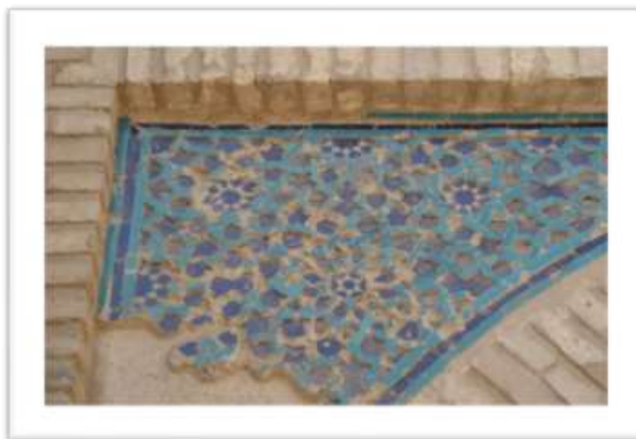
تصویر ۸: آرایه های هندسی همراه یا هنر آجر کاری و کاشی کاری

نقش هشت ضلعی و شمسه (تصویر ۹) در ایوان جنوبی و سردر مسجد جامع ورامین به وفور بکار رفته است که در هنر اسلامی دارای معانی و مفاهیم فراوانی است از جمله به عنوان نماد الوهیت و نور وحدانیت بکار می رود (خزایی، ۱۳۲: ۱۳۸۱).