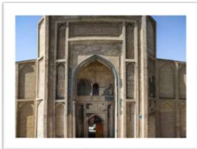
تصویر ۴: سردر شمالی مسجد جامع ورامین.

ایوان مرتفع جنوبی (تصویر ۵) و گنبد خانه ی مقصوره پشت آن محور شمالی- جنوبی قدرتمندی را ایجاد کرده است که ضمن تاکید بر جهت قبله بیشترین آرایه های مسجد را در این محور می توان مشاهده کرد (تصویر ۶).