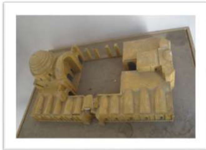
تصویر ۳: ماکت مسجد جامع ورامین

بنا بر کاوش هایی که در شبستان غربی مسجد بین سال های ۱۳۴۵-۵۴ انجام گرفت، شواهدی بدست آمد که احتمالاً به علت سیل قسمت هایی از مسجد به ویژه جبهه غربی تخریب گردیده است (فرحانی، ۱۳۸۱: ۴۴). بنابراین این آسیب ها باعث از دست رفتن دو مناره، و بخشی از رواق های غربی شده است که در سال های اخیر در نتیجه کاوش های باستان شناسی برخی از پایه های ضخیم آن از دل خاک بیرون آورده شده است (شیبانی و همکاران، ۱۳۶۵: ۴۹). در سال های اخیر سازمان میراث فرهنگی به مرمت و بازسازی قسمت های مختلف از بین رفته پرداخته است. بخش های مرمت شده همان قسمت هایی هستند که در فاصله زمانی بین اواخر دوره تیموری تا زمان مرمت آن ها به تدریج تخریب شده بودند (شیبانی، ۱۳۶۵: ۴۷-۵۰). بدین ترتیب وضعیت کنونی مسجد شامل اطراف میانرای مربع شکل آن که حوضی در میان دارد چهار ایوان به همراه رواق های، (تصویر ۳)