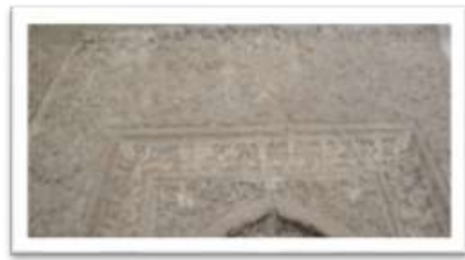
تصویر ۱۲: نقوش گیاهی بکار رفته در محراب مسجد جامع ورامین