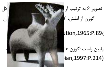
تصویر ۶ به ترتیب از بالا: گوزن از املش، گوزن سفالی گیلان (Golan, 1965: P.89) پایین راست: گوزن هاگیا (Golan, 1997: P.214)

از نظر پیشینه تصویری گوزن یکی از فراوان ترین حیواناتی است که به هیئت مجسمه یا ریتون سفالین، و یا به شکل پیکره مفرغی و نیز به شکل نقش برجسته در آثار باستانی گیلان دیده می‌شود. (تصویر ۶ و ۷)