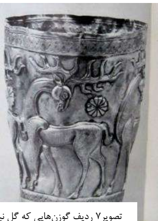
تصویر ۷ ردیف گوزن‌هایی که گل نیلوفر را حمل می‌کنند (Ghirshman, 1966: P.23)