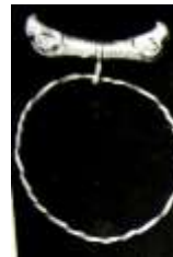
تصویر ۱۷ آویز طلا از مارلیک ، دو پرنده از گردن به هم چسبیده (نگهبان، ۱۳۷۶: ۴۵۱)