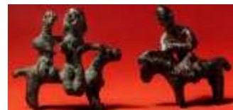
تصویر ۴، مجسمه اسب و سوار، برنز، املش، اوایل هزاره اول ق.م (Mahboubian, 1997: 218)