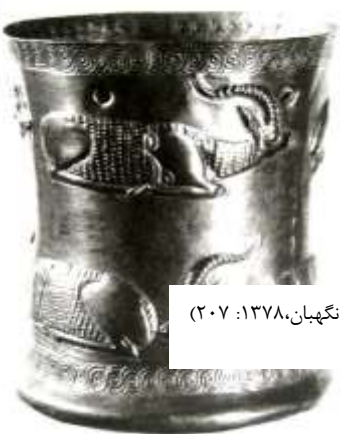
تصویر ۱۰ بز کوهی آرمیده، جامی از مارلیک (نگهبان، ۱۳۷۸: ۲۰۷)