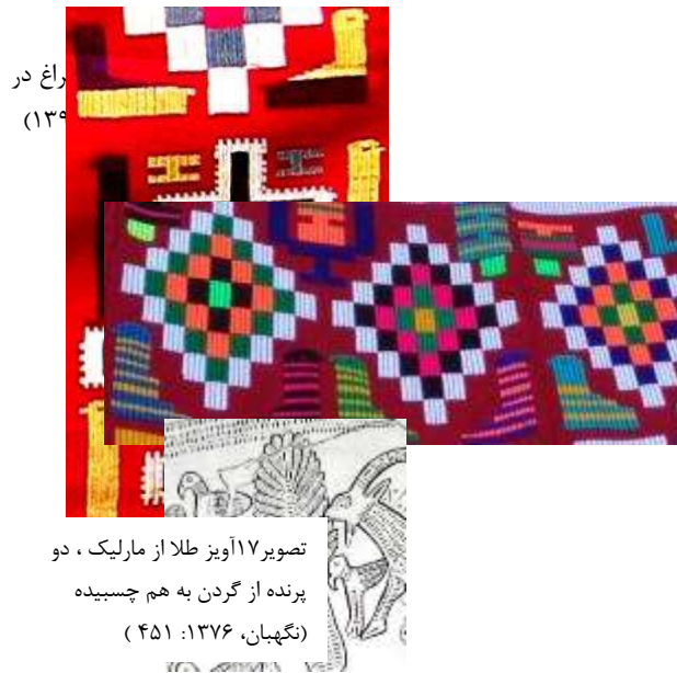
رأغ در (۱۳۴)