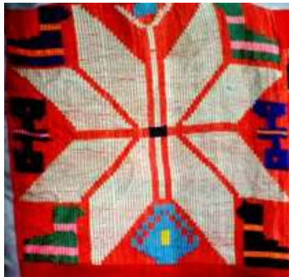
تصویر ۱۸ نماد پروانه بر چادر شب گیلان ، با چهار پرنده رود رو، دو تبرزین ، نماد سرو در پایین و نماد مربع در بالا) نگارنده: ۱۳۹۲)

یکی از نقوشی که در چادرشب گیلان به کار می‌رود نقش پروانه است. (تصویر ۱۸) این نقش در ترکیب‌های پنج تایی میان چهار پرنده روبرو و دو تبرزین قرار گرفته است. در مواردی کل سطح یک چادرشب را به عنوان یک نقشمایه سراسری پر می‌کند. مردم محلی آن را پروانه می‌نامند. نقش مایه پروانه در دستبافته‌ها و سایر هنرهای ایران و نیز دستبافته‌های ترکیه به کار می‌رود. چادرشب بافته‌ای قمریست بنابراین دگردیسی پروانه می‌تواند نمادی از دگردیسی ماه باشد. پس با محافظان اسطوره‌ای آسمانی، پرندگان احاطه شده است و شاید ارتباطی با وضعیت نجوم داشته باشد. این تفسیر با رمز پردازی پروانه کاملاً هماهنگ است.