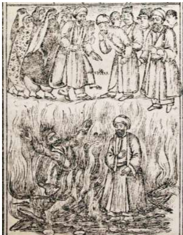
تصویر (۲): برگه‌ای از مستطاب‌المثنوی، در آتش رفتن دهری و متقی، قاجاری، کتابخانه ملی ایران، شناسه کتاب (۷۸۰۹۲۶)

در اینجا سیطره قدرت الهی بر اسباب و عوامل به هیچ‌عنوان به معنی نفی اختیار انسان نیست؛ زیرا حق تعالی به مقتضای حکمت خود برای حصول و وصول به مقاصد، وسایل و اسبابی را ساخته است که مانند حلقه‌های زنجیر به هم متصل‌اند. نادیده گرفتن