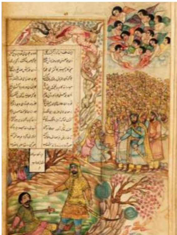
تصویر (۸): برگی از مثنوی، رویایی حضرت علی با دشمن خود و غلبه بر نفسش، ۱۶۶۲ میلادی، مرکز دیجیتال سازی مونیخ (MDZ)،

فکرتی کز شادایت مانع شود آن به امر و حکمت صانع شود آتش طبعت اگر غمگین کند سوزش از امر ملیک دین کند آتش طبعت اگر شادی دهد اندر او شادی ملیک دین نهد آب حلم و آتش خشم ای پسر هم ز حق بینی چو بگشایی بصر خرقه غم و شادی را دانی که که می دوزد وین خرقة ز دوزنده خود را چه جدا داند وی مبتنی بر مضمون حدیث دل مؤمن در میان دو انگشت خدای رحمان است آدمی را همچون قلمی بین دو انگشت مهر و قهر ذوالجلال می بیند که حالات گوناگون آن همچون حروفی بر صفحه دل نقش می بندد. مولانا آنچه بر دل وارد می شود را دست نویس قدرت حق می داند و یادآور می شود که تمامی حالات پیش آمده بر صلاح آدمی شکل گرفته است. دلیم همچون قلم آمد در انگشتان دلداری که امشب می نویسد زی، نویسد باز فردا ری قلم را هم تراشد او، رقا و نسخ و غیر از آن قلم گوید که تسلیم تو دانی من کیم، باری گهی رویش سیه دارد، گهی در روی خود مالد گهی او را سرنگون سازد، گهی سازد مدد کاری غ ۲۵۳۰ ب ۳-۱