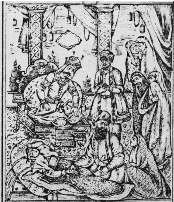
تصویر (۸): برگي از مستطاب‌المثنوی، حاضر شدن طبیب الهی بر بالین کنیزک، قاجاری، کتابخانه ملی ایران، شناسه کتاب (۷۸۰۹۲۶)

رنج‌ها دادست کان را چاره نیست آن به مثل لنگی و فطس و عمیست رنج‌ها دادست کان را چاره هست آن به مثل لقه و درد سرست این دواها ساخت بهر ایستلاف نیست این درد و دواها از گزاف بلک اغلب رنج‌ها را چاره هست چون بجد جویی بیاید آن بدست خدای پهلوی هر درد دارویی بنهاد چو درد عشق قدیمست ماند بی ز دوا د ۳/ب ۲۹۱۳-۲۹۱۶ غ ۲۲۳/ب ۹