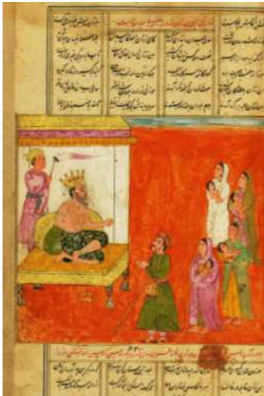
تصویر (۵): برگه‌ای از مثنوی، تدبیر فرعون برای سر بریدن نوزادان پسر، ۱۷ میلادی، موزه والترز (w626)، (www.art.thewalters.org)

حیله کرد انسان و حیله‌اش دام بود آنک جان پنداشت، خون آشام بود در بیست و دشمن اندر خانه بود حیله فرعون زین افسانه بود صد هزاران طفل کشت آن کینه‌کش و آنک او می‌جست اندر خانه‌اش د ۶۱۸-۶۲۰/ب ۱