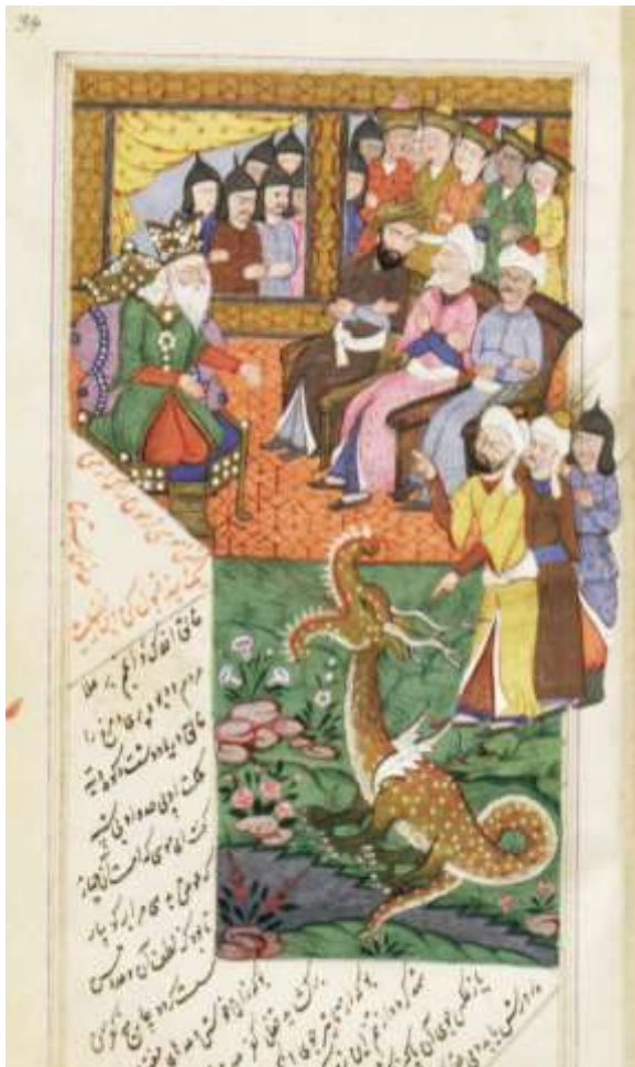
تصویر (۳): برگی از مثنوی، بند دادن موسی (ع) به فرعون، ۱۹ میلادی، کتابخانه دولتی برلین (Ms. Or. Oct. 3748)

درواقع مشیت الهی چنین است که هدایت به صورت کلی بر کسانی مؤثر می‌افتد که به وسیله هدایت تکوینی، یعنی به مدد عقل و فطرت خود، خویشتن را در مسیر هدایت تشریحی قرار دهند و مقصود از اضلال آن است که چون فردی از پذیرش آنچه هدایت