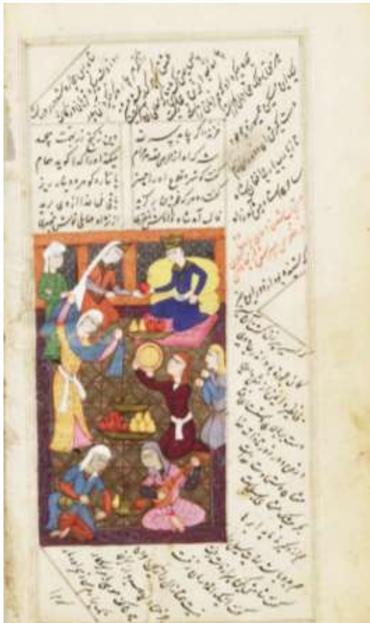
تصویر (۷): برگی از مثنوی، سرور پس از استجاب دعا، ۱۹ میلادی، کتابخانه دولتی برلین (Ms. Or. Oct. 3748) (www.digital-beta.staatsbibliothek-berlin.de)

نگاره مقابل به داستانی از دفتر چهارم مثنوی با عنوان «مستجاب شدن دعای پادشاه در خلاص پسرش از جادوی کابلی» دارد. در این داستان پادشاهی که پسری برنا و صالح داشت شبی خواب دید که او ناگاه گرفتار مرگ خواهد شد. این غم وی را سخت برآشفته و بر آن شد تا عروسی برای پسرش اختیار کند تا نسلش دوام یابد. پادشاه علی‌رغم اعتراض اهل حرم دختر درویشی را برای او برگزید تا اسیر حرص و طمع نباشد. چون این ازدواج صورت گرفت، عجزه‌های کابلی که عاشق شاهزاده بود وی را با سحر به عشق خود گرفتار کرد. شاه هر چاره‌ای که می‌اندیشید مهر پسر بر پیرزن بیشتر می‌شد بنابراین تنها علاج خود را در دعا و زاری به درگاه حق یافت. سجده می‌کرد و می‌گفت خدایا فرمان برای توست و ای رحیم تو دست مسکین را بگیر. این دعا و فغان تأثیر کرد و خداوند ساحری را فرستاد تا جادوی پیرزن را باطل کند. عمل وی کارگر افتاد و پسر به‌سوی پدر دوان شد و بر زمین سجده می‌کرد. شاه دوباره مراسم عروسی را برای وی با دخترک ترتیب داد که در نگاره نیز همین شادی بعد از نزول نعمت و استجاب دعا از سمت خداوند با نمایش نوازندگان، رقصندگان و اقلامی برای پذیرایی به تصویر درآمده است.