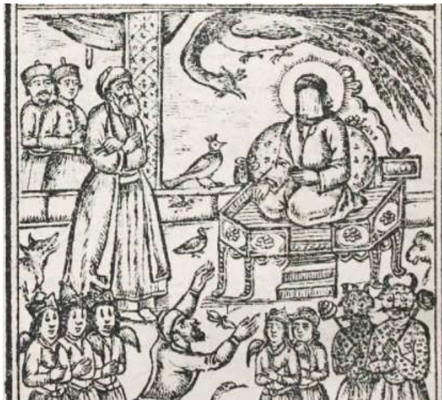
تصویر (۹): برگگی از مستطاب المثنوی، رسیدن مردی به خدمت حضرت سلیمان برای رهایی یافتن از مرگ، قاجاری، کتابخانه ملی ایران، شناسه کتاب (۷۸۰۹۲۶)

بحث مشیت و اراده حق از مهم ترین بحث های علم کلام است که بسیاری از متکلمان، فلاسفه و عرفا به توضیح آن پرداخته اند. هنگام بررسی مشیت الهی از منظر مولانا درمی یابیم که آنچه وی متعلق و معطوف به اراده خداوند می داند در حقیقت همه آن چیزی است که در هستی جریان دارد. این طرز فکری است برآمده از آیات قرآن که در واقع بنای تمامی عقاید مولانا بر آن استوار است. چنین بینشی در جای جای اشعار وی در مثنوی و دیوان شمس دیده می شود و البته تمامی این تأکیدها، ناچیزی انسان و افعالش را در برابر قدرت مطلق خداوند به یاد می آورد و این حقیقتی است که مولانا در پس این ابیات جبر گونه مدنظر داشته است چرا که دفاعیات وی از اختیار انسان تصور جبراندیشی او را از میان برمی دارد. این دو اثر ارزشمند مولانا چنان که گفته شد بارها و بارها بازنویسی شده و نسخ نفیسی که در کتابخانه ها و موزه های سراسر دنیا از آنها یافت می شود گواه این حقیقت است. ولی تعداد نسخه های مصور از این نسخ