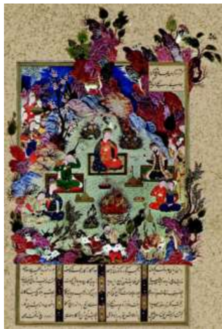
تصویر ۱) نگاره جشن سده، منصوب به سلطان محمد، شاهنامه طهماسبی. (آژند، ۱۳۸۴: ۱۲۱)

بنابر گفته های هینلز؛ این جشن و سرور در طول قرن ها همچنان ادامه پیدا کرد. در جشن های سده، آتش بزرگی در بیرون خانه ها برپا می کردند و مردم بر گرد آن می خواندند و می رقصیدند و هر کس با آوردن چوب برای آتش در آن شرکت می کردند و این نشان از جنگ با شیطان و پلیدی و سرمای زمستان داشت. (هینلز، ۱۳۷۵)