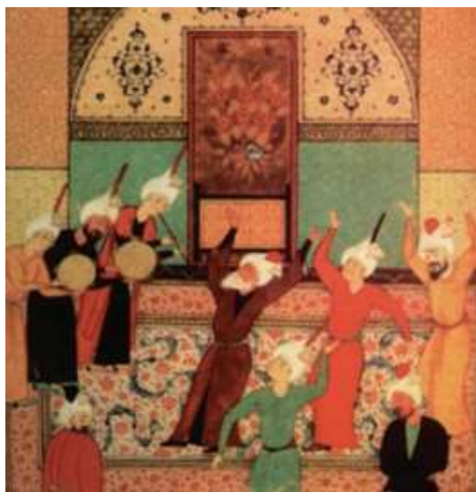
تصویر ۳) سماع درویشان.

اهمیت به موسیقی به اندازه‌ای است که عده‌ای آن را از بهشت می‌دانند. از این روست که نشانه‌هایی از موسیقی را در نگاره‌هایی با این مضامین و در نگاره‌هایی که طبیعت و بهار مثالی تصویر شده است، مشاهده می‌کنیم.