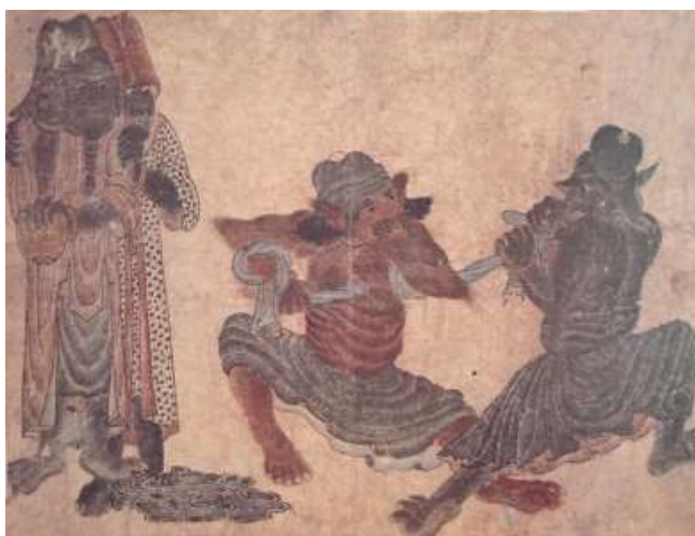
تصویر شماره ۷ طناب کشی - محمد سیاه قلم

از خصوصیات آثار محمد سیاه قلم که حضور دیو در ترکیب آنها مشاهده می گردد این است که در هر نگاره، رنگها محدود است به دو یا سه رنگ که باهم هارمونی دارند و روی زمینه ای تک رنگ با بافت های ملایم کار شده است. در رنگ گذاری اندام دیو ها از رنگ هایی چون سیاه، درجات قهوه ای، کرم، عنابی، خاکستری وحنایی استفاده شده است. همانطور که در بالا ذکر گردید در هر نگاره دو یا سه نمونه از درجات رنگ های فوق برای دیوها اختیار گردیده است. در اغلب موارد بدن دیوها دارای بافت است، این بافت در بعضی موارد بوسیله ی موهای ریز یا موهای درشت و بلند، در برای موارد خال ها و در اغلب موارد چین هایی نشان داده می شود که مانند بافت روی بدن کرگدن است. اغلب نگاره ها با مرکب یا آبرنگ روی سطحی مثل کاغذ اجرا گردیده است.