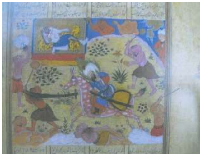
تصویر شماره ۲۷ حضرت امیر درنبرد با موجودات افسانه ای-فرهاد شیرازی ، خاوران نامه، ۸۸۲_ ۸۹۲ ه ق -کاخ گلستان.

در نگاره مذکور نه دیو دیده می شوند، همه دیوها چهره و اندامی شبیه به آدمیان دارند به گوش های باد بزنی شبیه قبل، اندام ها کوچک است، قیافه ها چندان وحشتناک نیست، از ریش و موی بلند در چهره ی این دیوها اثری دیده نمی شود، دندان های نیشی وجود ندارد که از دهان بیرون زده باشد. تنها وجه تمایز آنها با آدمیان در گوشه های بزرگ و باد بزنی شان است که شبیه گوش فیل است، مچ بند و خلخال بر دست و پاهایشان دیده نمی شود، تنها شلیته ی ساده به کمر بسته اند، زر و زیور دیو های افسانه ای بر قامت این دیوها دیده نمی شود و همه ی آنها داری از تزئینات هستند. نگارگر عموماً از رنگهای گرم برای رنگ آمیزی بدن دیوها استفاده نموده است، به جز دیو سفید نشسته بر تخت که از نظر رنگی با دیگران تفاوت دارد، بافت بدن دیوها زمخت نیست و لطافتی شبیه به بدن انسانها دارد. (تصویر شماره ۲۷).