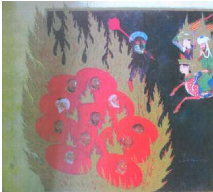
تصویر شماره ۱۸ شکنجه ی تنگ چشمی (خسیسی)-نگاره شماره ۵۴ از کتاب معراج نامه

در اینجا هم گرز قرمز رنگ در دست دیو، نماد آتش است، همینطور پلکهای برافروخته و شلیته ی قرمزی که بر تن دیو دیده می شود، به این گرما و حرارت دوزخ کمک کرده است.