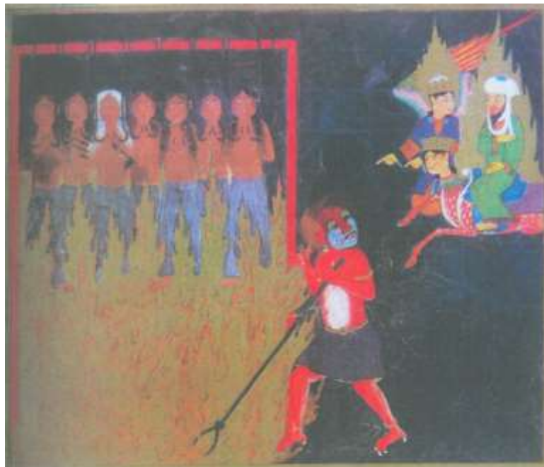
تصویر شماره ۱۷ کیفری مختص زنان زناکار-نگاره شماره ۵۳ از کتاب معراج نامه

در بالای نگاره سمت چپ، زنان زناکاری مشاهده می‌شوند که به وسیله‌ی قلابهایی که از سینه‌هایشان عبور کرده در آتش آویخته شده‌اند. دیوی که مأمور شکنجه کردن این گناهکار می‌باشد از بخش تاریخ دوزخ به سمت شعله‌های آتش در حال حرکت است، گرز سیاه رنگ که سر آن به شکل قلاب است رابه دست چپ گرفته و با دست راست به سوی زنان گناهکار اشاره می‌کند، صورت دیو به رنگ قرمز و آبی روشن است، بالای پلکهایش هاله‌ای به رنگ طلایی مشاهده می‌شود، این دیو هم مانند برخی دیوهای دیگر معراج نامه به رنگ قرمز رنگ آمیزی شده که سرخی رنگ بدنش می‌تواند علامت گداختگی و علامت شدید دوزخ باشد، سرش پر مو و بینی اش پهن و بزرگ است، خلخال بر مچ پایش بسته، بازوبند و کمر بند ی هم به کمر دارد که همه به رنگ طلایی هستند چنگالهای تیز و سفید رنگی روی انگشتان پایش دیده می‌شود اما دستانش کوچک و شبیه دستان آدمیان است، این خصوصیت کوچک بودن دست، بلا استثناء در همه‌ی دیوهای معراج نامه دیده می‌شود.