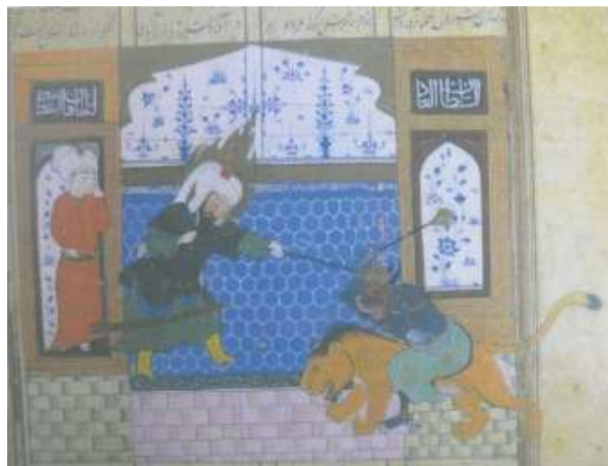
تصویر ۳۰ حضرت امیر (ع) و مالک در مکان غریب - فرهاد شیرازی، خاوران نامه، ۸۲۲-۸۹۲ ه ق - کاخ گلستان

در این نگاره دیوی خاکستری رنگ را می‌بینیم که بر شیر سوار شده است و در حال نبرد با حضرت امیر می‌باشد. این دیو از نظر طراحی با دیگر دیوهای موجود در خاوران نامه، تفاوت محسوسی دارد. چهره و اندامش تنومندتر است. چنگال‌های تیزی دارد و دندان‌های نیشش از دهان بیرون زده است. شاخ‌های بلند و برگشته است. نکته دیگری که در این نگاره جلب توجه می‌کند این است که این دیو بر شیری سوار شده است که نمونه آ را در نگاره‌های دیگر خاوران نامه نمی‌توان یافت. (تصویر ۳۰)