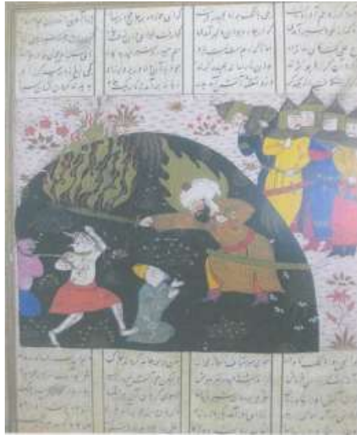
تصویر شماره ۲۶ نبرد حضرت امیر(ع) با موجودات افسانه ای-فرهاد شیرازی - خاوران نامه، ۸۸۲-۸۹۲ ه ق، کاخ گلستان.