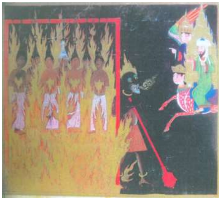
تصویر شماره ۱۴ زنان بی عفت - نگاره شماره ۵۰ از کتاب معراج نامه

در این نگاره زنان گناهکار با موهایشان در میان شعله های آتش آویزان شده اند، آنها توسط دیوی قهوه ای رنگ که در محدوده ی تاریک دوزخ ایستاده است، شکنجه می شوند، چشمان دیو از حدقه بیرون زده، پلک هایی سبز رنگ چشمانش را احاطه نموده است، آتش از دهان و بالای سرش شعله ور است، گریزی قرمز رنگ در دست دارد و پاهایش چنگال مانند است، گردن بندی به گردن و خلخالی بر پا دارد.