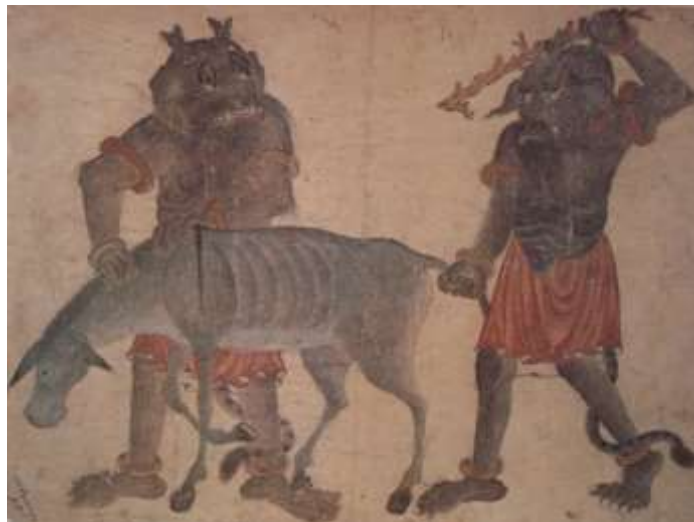
تصویر شماره ۶ دو دید تلاش می کنند الاغ لجوجی را حرکت دهند - محمد سیاه قلم.

تصویر شماره ۵ دیوها در حال نزاع - محمد سیاه قلم.