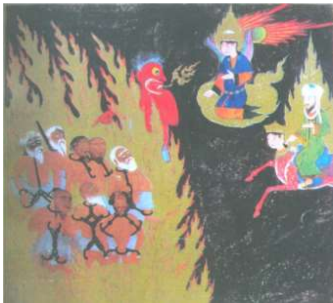
تصویر شماره ۱۹ تمحیل شکنجه و عذاب بر ریا کاران و چابلوسان-نگاره ی شماره ۵۵ از کتاب معراج نامه