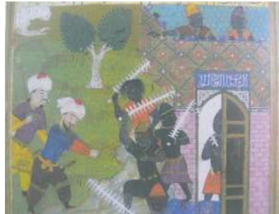
تصویر شماره ۳۵ دیوها در حال رقص - بخشی از تصویر - محمد سیاه قلم - تحرک دیوها را در این دو نگاره با یکدیگر مقایسه نمایید.