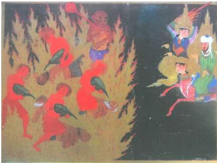
تصویر شماره ۱۶ عذاب غاصبان سهم یتیمان -نگاره شماره ۵۲ از کتاب معراج نامه

در این نگاره چهار دیو قرمز رنگ و قرمز پوش باظروفی سبز رنگ در دست، زهر تهیه شده از درخت زقوم را به دهان افراد گناهکار می ریزند، دیوی قوی هیكل بالای سر آنها ایستاده و بر کار آنها نظارت می کند، مرسی آتشین را بردوش راست خود گرفته و با انگشت دست چپ به گناهکاران اشاره می نماید، رنگ بدنش قهوه ای مایل به قرمز و شکمش با رنگی روشن تر یعنی زرد نارنجی رنگ آمیزی شده است، شلیته ای به رنگ آبی بنفش بر تن دارد، چهره ی دیو دارای چروکهایی است که نظیر آن را در چهره ی دیو های محمد سیاه قلم می توان دید، همینطور بینی پهن آن به دیو های سیاه قلم شباهت دارد، کله دیو مذکور تاس است.