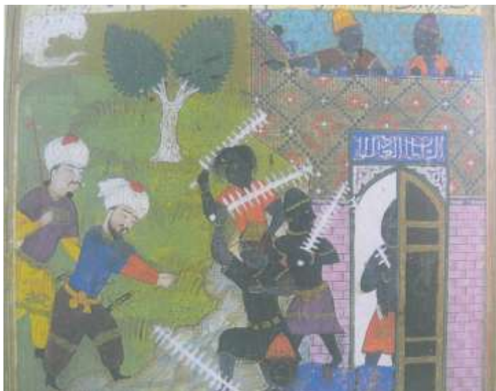
تصویر شماره ۲۸ نبرد مالک و امیر زنهار بادبوسانان - فرهاد شیرازی، خاوران نامه، ۸۸۲_ ۸۹۲ ه ق - کاخ گلستان.

در این نگاره هم دیوها که سلاح هایی اره مانند در دست گرفته اند، شباهت زیادی به آدمیان دارند، بالاپوش و شلیته ای بر تن کرده اند، نشانه ی خاصی که آنها را به دیو شبیه سازد در چهره و اندامشان دیده نمی شود مگر رنگ چهره ها که سیاه و کریه است و در بعضی از آنها به رنگ جامه شان نزدیک شده است، فقط همه ی دیوها مچ بندهایی بر دست بسته اند و یکی از آنها گردن بندی به گردن و گوشواره ای به گوش کرده است که او را بیشتر به دیوها شبیه می کند، حضور بافت دراندام و لباس چندان حس نمی شود. (تصویر شماره ۲۸).