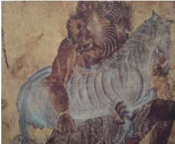
تصویر شماره ۴۱ دیوی در حال ربودن اسب - بخشی از تصویر - محمد سیاه قلم - عنصر بصری بافت را در دو نگاره با یکدیگر مقایسه نماید.

۵- حضور بافت در آن‌ها ملموس نیست در حالی که یکی از خصوصیات بارز دیوهای سیاه قلم بافت زمخت و متنوع آنهاست (تصاویر شماره ۴۰ و ۴۱).