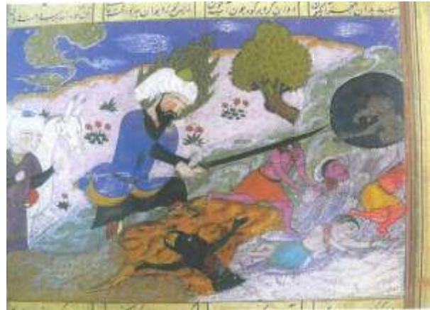
تصویر شماره ۴۲ حضرت امیر در نبرد با موجودات افسانه‌ای خاوران نامه