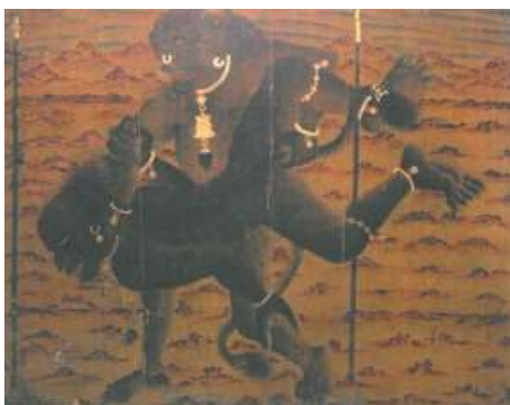
تصویر شماره ۳۹ دیوی دیگر را در بند کرده است-محمد سیاه قلم- زیور آلات دیوهای دو نگاره را با یکدیگر مقایسه نمایید.

۴- زیورآلات آن ها اندک است و چندان به چشم نمی آید. در حالی که دیوهای سیاه قلم اغلب دارای زیور آلات متنوع هستند (تصاویر شماره ۳۸ و ۳۹).