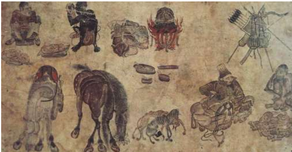
تصویر شماره ۴ اردوی بدوی - محمد سیاه قلم - قرن نهم ه ق - موزه توپقاپی سرای استانبول

تصویر شماره ۳ سه نفر در حال گفتگو - بخشی از اثر محمد سیاه قلم - قرن نهم ه ق - موزه توپقاپی سرای استانبول در تصویر شماره ۴ در طراحی اندام اسبها اغراق شده است، دست و پای اسب سمت راست درهم تنیده، سمها در جهات متفاوت و غیر متعارف چرخیده اند، این در هم تنیدگی در اندام سگها و آدم چمباتمه زده در سمت راست تابلو نیز به خوبی دیده می شود، صورت اسب سمت چپ دارای عضلات بیش از حد قوی می باشد، در کل اغراقهایی را در تصویر می بینیم که در آثار کوبیستی مانند تابلوهای خلق شده توسط پیکاسو دیده می شود. آثاری که قبل از دوره ی تحول تکنیکی خلق شده اند دارای تنوع رنگی بیشتری نسبت به آثار متأخر نقاش هستند، فضای کار شلوغ تر است و آثار دارای بعد بیشتری هستند، اغلب این آثار دورنما و بعد ندارد و روی یک زمینه ی تخت کار شده اند . تصاویر ۳ و ۴ را مقایسه کنید.