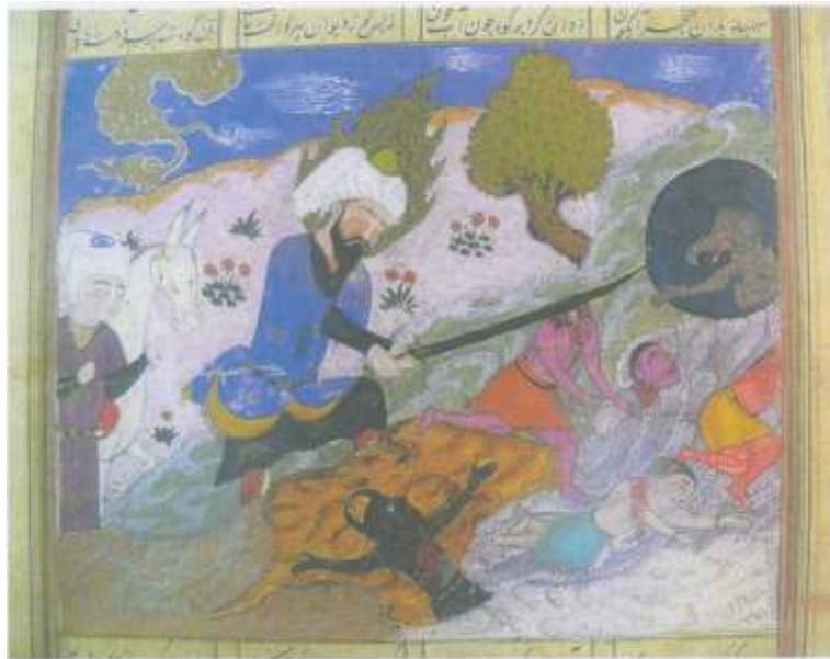
تصویر شماره ۳۱ نبرد حضرت امیر(ع) با موجودات افسانه ای - فرهاد شیرازی، خاوران نامه، ۸۲۲-۸۹۲ ه ق - کاخ گلستان

سه دیو از نگاره ی مذکور بیشتر به انسانها شبیه هستند تا دیوها، اغلب آنها شاخ مدارند، دیوی که سر از بدنش جدا شده خیلی شبیه به آدمیان است مخصوصا سبیل و ابروی باریک آن، موجود سمت راست که سر از چاه بیرون آورده، دماغی شبیه به فیل دارد، اما گوشش کوچک است و دستش هم شبیه آدمیان است. موجود سمت چپ اندام انسان گونه دارد اما رنگ تیره بدنش و شاخی که بر سر دارد آن را به دیوها شبیه نموده است، زیورآلات اندکی بر بدن دیوها دیده می شود. یکی از نکات قابل توجه در این نگاره رنگ های متنوعی است که در بدن دیوها به کار رفته، ارغوانی، نارنجی، رنگ استخوانی و قهوه ای تیره و روشن، یعنی هر دیدی رنگ خاص خودش را دارد. (تصویر شماره ۳۱).