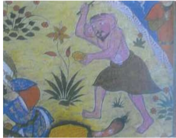
تصویر شماره ۴۰ حضرت امیر در نبرد با موجودات افسانه‌ای - بخشی از تصویر - خاوران نامه

۶- دیوهای خاوران نامه در مقایسه با دیوهای محمد سیاه قلم از نظر فام از تنوع بیشتری برخوردار هستند و با رنگ‌هایی مانند ازغوانی، صورتی، نارنجی، قهوه‌ای و سفید و سیاه رنگ گذاری شده‌اند. در حالیکه دیوهای محمد سیاه قلم دارای درجات رنگی هم خانواده هستند و به اصطلاح الوان نیستند (تصاویر شماره ۴۲ و ۴۳).