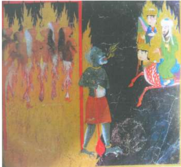
تصویر شماره ۱۵ زنان سبک رفتار-نگاره ی شماره ۵۱ از کتاب معراج نامه