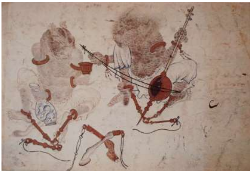
تصویر شماره ۱ دیوها در حال نواختن ساز - منسوب به محمد سیاه قلم - قرن نهم ه ق - موزه ی توپقاپی سرای استانبول

استفاده از زر و زیور زیاد، در دیوهای محمد سیاه قلم و اعمال و رفتاری که انجام می دهند این فرضیه را به حقیقت نزدیکتر می کند که اینها همان آدمیانی هستند که به لباس دیو درآمده اند. محمدعلی کریم زاده در این باره چنین می گوید: «...می شود گفت که هیبت و قیافه ی دیوهایی که سیاه قلم به رشته تصویر در آورده، درحالت استثنایی بوده و قبل از وی بدین شیوه و شمایل دیده نشده اند و بعید هم نیست، علت ارائه ی چنین تصاویری، برداشت طنزآمیز از افراد زر خرید و غلام سیاه های درآمده و یا جماعت اشقیاء در مغولستان بوده و با این شیوه ی ابتکاری، توانسته است مصائب و بدبختیهای آنها را در مقابل ظلم و ستم اربابان، به منصفه دیدار مسئولان برساند.» ۱