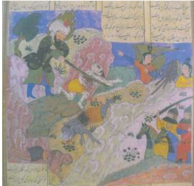
تصویر شماره ۲۹ حضرت امیر (ع) در مصاف با موجودات افسانه‌ای - فرهاد شیرازی، خاوران نامه، ۸۲۲-۸۹۲ ه ق - کاخ گلستان