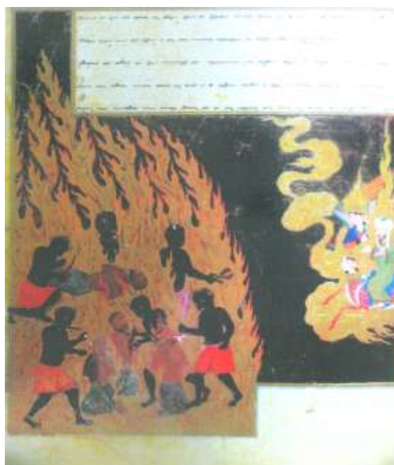
تصویر شماره ۱۰ مجازات بدگویان-نگاره ی شماره ۴۶ از کتاب معراج نامه

در این نگاره دیو های سیاه رنگی را می بینیم که شلیته های قرمز و خردلی به تن دارند و گوشت بدن گناهکاران را بریده، مجبورشان می کنند تا آن گوشتها را بخورند، در این نگاره هم دیو ها دارای اندام متناسب با آدمیان گناهکار هستند، از چنگالهای تیز و دندان های نیش برآمده از هان و کله های بزرگ و پشمالو که شاخصه های یک دیو عظیم الجثه و مهیب است در این دیو ها اثری دیده نمی شود، تنها رنگ سیاه بدن، آنها را از آدمیان مجزا می کند.