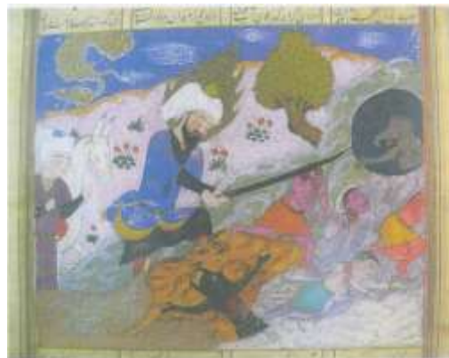
تصویر شماره ۳۶ حضرت امیر در مصاف با موجودات افسانه‌ای- خاوران نامه

۴- زیورآلات آن ها اندک است و چندان به چشم نمی آید. در حالی که دیوهای سیاه قلم اغلب دارای زیور آلات متنوع هستند (تصاویر شماره ۳۸ و ۳۹).