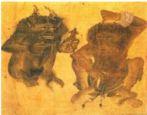
تصویر شماره ۴۳ دیوها در حال گفتگو - محمد سیاه قلم - عنصر بصری رنگ را دو نگاره با یکدیگر مقایسه نماید.

۶- دیوهای خاوران نامه در مقایسه با دیوهای محمد سیاه قلم از نظر فام از تنوع بیشتری برخوردار هستند و با رنگ‌هایی مانند ازغوانی، صورتی، نارنجی، قهوه‌ای و سفید و سیاه رنگ گذاری شده‌اند. در حالیکه دیوهای محمد سیاه قلم دارای درجات رنگی هم خانواده هستند و به اصطلاح الوان نیستند (تصاویر شماره ۴۲ و ۴۳).