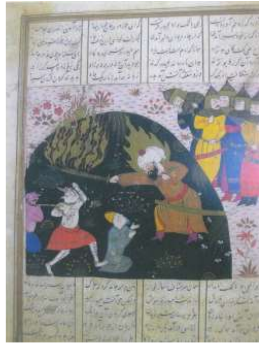
تصویر شماره ۳۳ دیو، انسانی را می رباید - بخشی از تصویر - محمد سیاه قلم - بزرگی پیکر دیو سیاه قلم را با دیوهای نگاره سمت راست مقایسه نمایید.