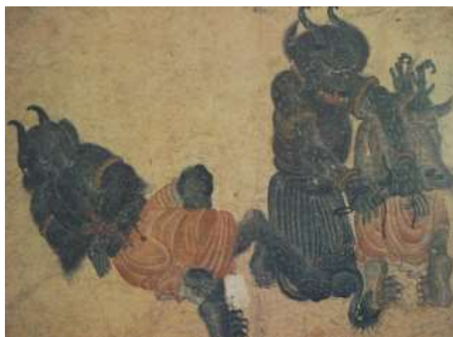
تصویر شماره ۲۴ دیوی دو دیو دیگر را در بند می کند - محمد سیاه قلم

عامل رنگ و بافت را در دونگاره فوق مقایسه نمایید