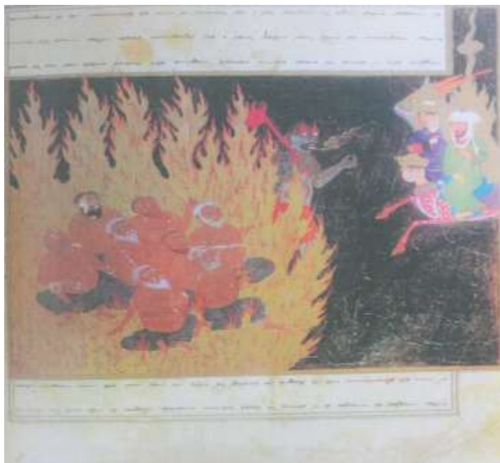
تصویر شماره ۱۱ آز و حرص مال اندوزی-نگاره ی شماره ی ۴۷ از کتاب معراج نامه

در این نگاره دیوی خاکستری رنگ با چشمانی برافروخته که پلک های سرخ آتشین آنها را در بر گرفته، گریزی قرمز رنگ بر دوش دارد که کله ی حیوانی شبیه به دیو بر سر آن نقش بسته است و آماده ی مجازات گناهکاران حریص و ما اندوز می باشد، از دهان دیو آتش زبانه می کشد، شلیته قرمز رنگ بر تن دارد و روبروی پیامبر (ص) ایستاده است و دست چپش را بالا گرفته، گویی با ایشان و همراهانشان در حال سخن گفتن است.