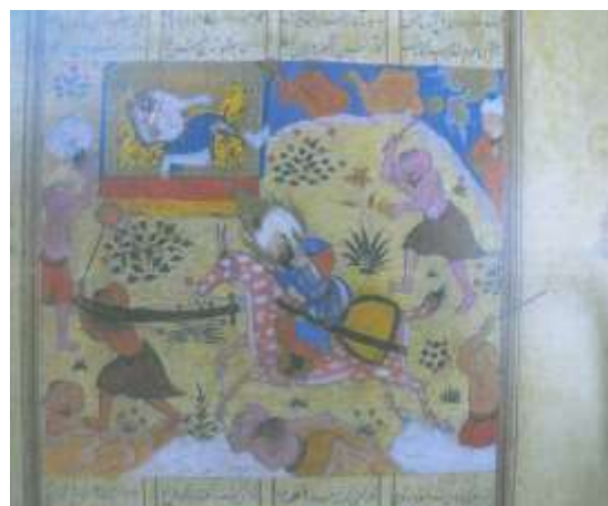
تصویر شماره ۳۸ حضرت امیر در نبرد با موجودات افسانه‌ای- خاوران نامه