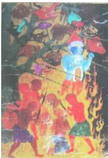
تصویر شماره ۲۵ درخت دوزخی - بخشی از تصویر - معراج نامه

۳- عامل بافت فقط در موی دیوها دیده می شود، بدن آنها بافت ملایمی دارد و اگر اندک بافتی روی بدن ها باشد در تصاویر دیده نمی شود. شلیته ها هم ساده و بدون بافت است و فقط چین خوردگی اندکی در آنها دیده می شود. (تصویر شماره ۲۵).