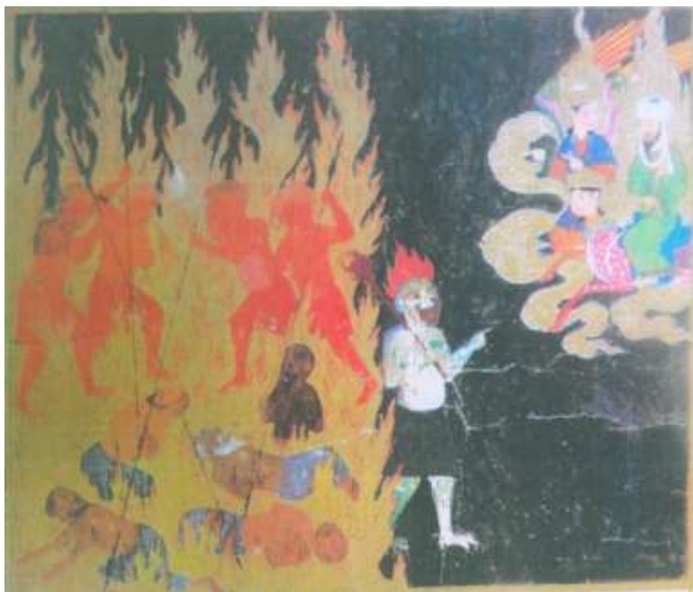
تصویر شماره ۱۲ منافقان (باشندگان بدر نفاق) - نگاره ی شماره ۴۸ از کتاب معراج نامه