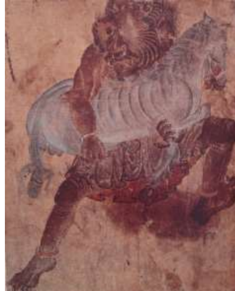
تصویر شماره ۲۰ دیوی در حال ربودن اسب - بخشی، از تصویر - محمد سیاه قلم

۳- شلیته ها و دیگر لباس های دیوهای سیاه قلم دارای چین و شکن زیادی است و به اصطلاح خوب به اندام آنها نشسته است در حالی که دیوهای معراج نامه، شلیته هایی ساده بر تن دارند که دارای چین و چروک اندکی است و در خیلی موارد این چین و شکن ها به چشم دیده نمی شود.