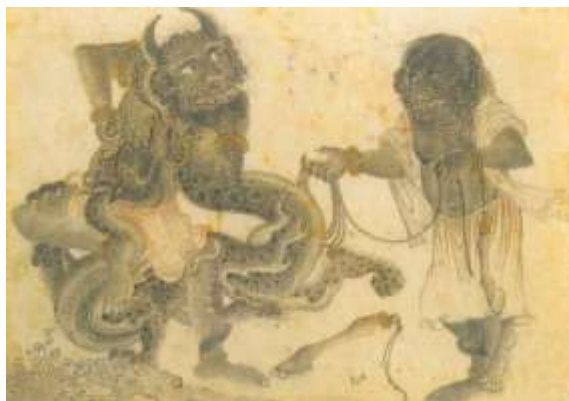
تصویر شماره ۳۷ دیوها ازدها را دربند می کنند- محمد سیاه قلم- حالات چهره، دندان ها و چنگال های دیوهای سیاه قلم را با نگاره سمت راست مقایسه نمایید.

۳- اکثر آن ها فاقد دندان های نیش بلند، چنگال های تیز و چهره های وحشتناک می باشند اما این خصوصیات را می توان در دیوهای سیاه قلم دید (تصاویر شماره ۳۶ و ۳۷).