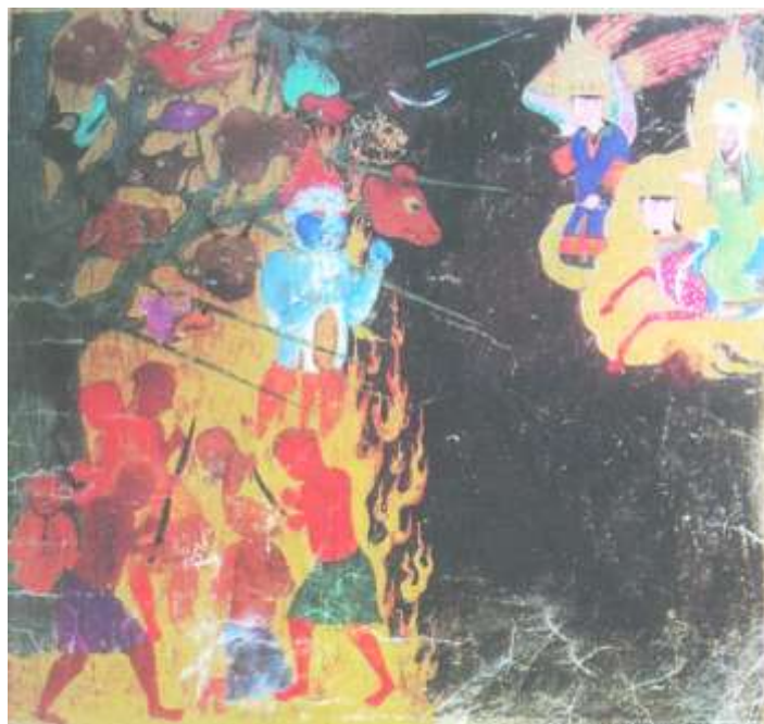
تصویر شماره ۹ درخت دوزخی - نگاره ی شماره ۴۵ از کتاب معراج نامه