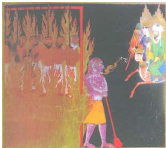
تصویر شماره ۱۳ ریاکاران (تظاهرکنندگان به دینداری) - نگاره ی شماره ۴۹ از کتاب معراج نامه

در این نگاره گناهکاران به وسیله ی چنگال هایی در میان شعله های آتش آویخته شده اند، و دیوی ارغوانی رنگ مأمور مجازات آنهاست، دیو در مقابل پیامبر (ص) ایستاده و بر گرز قرمز رنگش تکیه زده است در حالیکه شعله ی آتش از بینی اش زبانه می کشد، دستهای دیو مانند دست یک انسان عادی، کوچک و ظریف است اما پاهایش بزرگ و دارای چنگالهای تیز است.