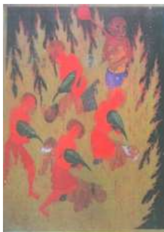
تصویر شماره ۲۳ عذاب غاصبان سهم یتیمان - بخشی از تصویر - معراج نامه

۴- دیوهای محمد سیاه قلم اغلب دارای زیور آلات متعددی هستند که در نگاه اول جلب توجه می کنند در حالیکه دیوهای مأمور عذاب عاری از زر و زیور می باشند. (تصاویر شماره ۲۲ و ۲۳).