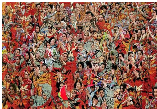
تصویر (۴): «گم کردن هویت‌مان» اثر صادق تیرافکن