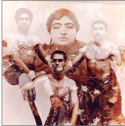
تصویر (۵): «مجموعه تصویر خیال»، اثر بهمن جلالی، ابعاد ۴۰*۴۰ سانتیمتر