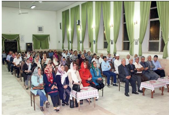
تصویر (۴): برگزاری جشن مهرگان در تالار آتشکده کرمان ۶