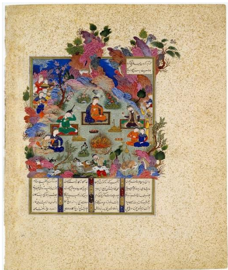
تصویر (۲): نگاره‌ای از شاهنامه (جشن سده) ۴

همگانی بودن جشن سده در بین همه‌ی قشرهای اجتماعی و دینی و شغلی کرمان و دل‌بستگی و توجه صمیمانه‌ی همه‌ی آن‌ها به مشارکت در آیین سده‌سوزی، معرف پیشینه‌ی کهنسالی و دیرپایی آن است. جشن و آیین سده - تا جایی که اطلاع در دست است - تنها در کرمان رسمی و عمومی است و همه مردم شهر اعم از زرتشتی، یهودی، مسیحی و مسلمان، ثروتمند و فقیر، کارمند و کاسب در آن شرکت می‌کنند. جشن سده را می‌توان «جشن کرمان» نامید (روح‌الامینی، ۱۳۷۴: ۳۰۹).