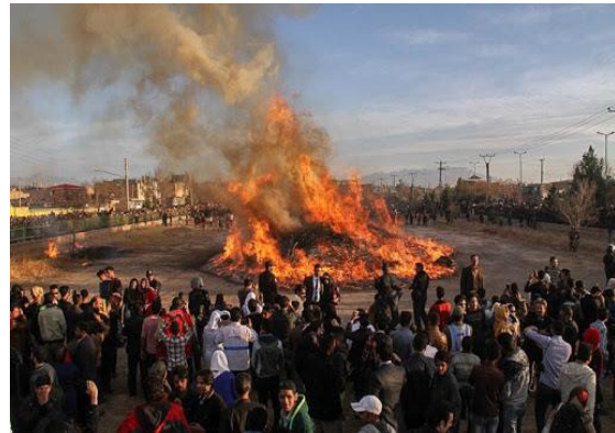
تصویر (۳): برگزاری جشن سده در کرمان ۵