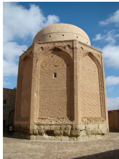
تصویر (۱): بنای تاریخی چلبی‌اوغلی (خانقاه دوره‌ی ایلخانی)

معماری دینی در مجموع با نمادپردازی به گونه‌ای که اندیشه‌های دینی و قدسی را پدیدار کند، عجین است؛ «هنر بصری اسلامی بازتاب کلام قرآنی است. در واقع پیوند حیاتی میان کلام قرآنی و هنر بصری اسلامی را نباید در مرتبه بیان صوری جست‌وجو کرد... هنر اسلامی اساساً برگرفته از توحید است» (بهرامی‌نژاد و کابلی، ۱۳۹۸: ۳۲). به بیان دیگر هنر معماری اسلامی، مکاشفه‌ای است از صور گوناگون هستی تا حقیقت این صور را در قالب کلام، موسیقی، تصویر، حجم و معماری به تجسم و نمایش بگذارد و در روند این مکاشفه، حیات فردی و جمعی انسانی را اعتلا دهد تا آن حد که به قرب الهی برساند (رهنورد به نقل از چرخیان، ۱۳۹۸: ۷۲). اعتلای انسان در نظام اسلامی در تمام ابعاد زندگی آدمی دیده می‌شود. در حقیقت در اسلام هیچ حرکتی از بُعد الهی رها نیست و هیچ حوزه‌ای نمی‌تواند از ارتباط با مفاهیم قدسی رها شود. به همین دلیل، برای بازخوانی نظام فضایی معماری اسلامی نیز باید ساختار اعتقادی و بنیادی اسلام مورد توجه قرار گیرد (ظفرنوازی، ۱۳۹۶: ۶۵).