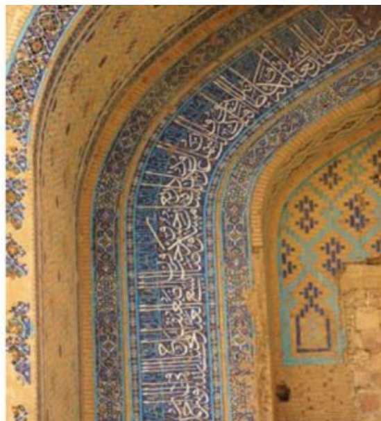
تصویر شماره ۲: کتیبه طوماری در مسجد خرگرد از بناهای دوره تیموری، ساخته شده در سال ۸۴۸ق.

این کتیبه که از نوع کتیبه‌های طوماری است به خط ثلث و کوفی است و دربردارنده مضامین مذهبی است. بررسی مفاد این کتیبه نشان می‌دهد، القاب شاهرخ که در سلطنت او این بنا ساخته شده است با کاشی معرق در این کتیبه تکرار شده است. واکاوی داده‌های آموزشی این کتیبه به نوعی تکرار روزمره صفات و القاب شاهی برای علم‌آموزانی است که در این مدرسه مشغول به تحصیل بوده‌اند در حقیقت می‌توان از آن به عنوان مشق وفاداری سیاسی برای علم‌آموزان یاد کرد.