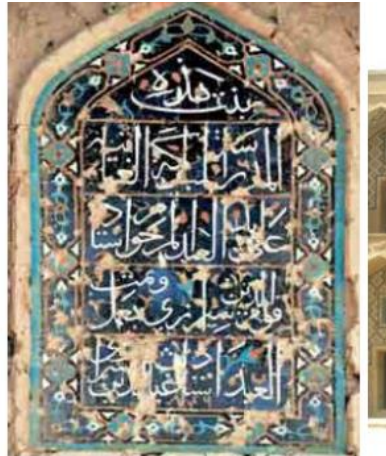
تصویر شماره ۱: کتیبه احداثیه مسجد خرگرد

مطالعه و واکاوی مفاد کتیبه‌های موجود در معماری دوره تیموری نشا می‌دهد این آثار دارای ارزش و اهمیت آموزشی هستند. کتیبه‌های این دوره را می‌توان در بناهای مختلفی مانند مساجد، خانه‌ها و بناهای عام‌المنفعه مانند کاروانسراها مشاهده نمود. بخشی از اطلاعات این کتیبه‌ها که گواه بر دوره ایجاد و مقطع تاریخی خاصی است در بردارنده نکات آموزشی مفیدی است. کتیبه‌های تاریخی شناسنامه بنا هستند. متن این کتیبه‌ها در بردارنده اطلاعاتی درباره بانی، مباشر، معمار و تاریخ ساخت بنا است و از آنجا که اطلاعاتی درباره احداث بنا را می‌دهد به آن‌ها کتیبه‌های احداثیه نیز گفته می‌شود. در کتیبه‌های احداثیه متن را چنان تنظیم می‌کردند که نام حاکم وقت درست در وسط کتیبه قرار گیرد (طبسی و رئوف‌حجار زرین، ۱۳۹۲: ۳). کتیبه‌های احداثیه معمولاً در بردارنده اطلاعات تاریخی مفیدی هستند.