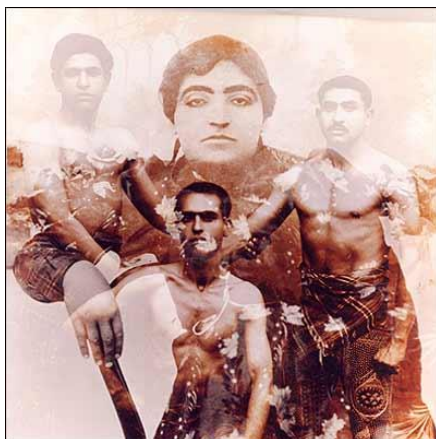
تصویر (۵): «مجموعه تصویر خیال»، اثر بهمن جلالی، ابعاد ۴۰*۴۰ سانتیمتر