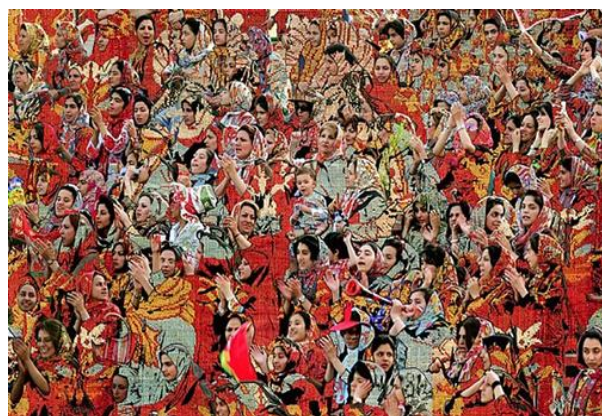
تصویر (۴): «گم کردن هویت‌مان» اثر صادق تیرافکن.