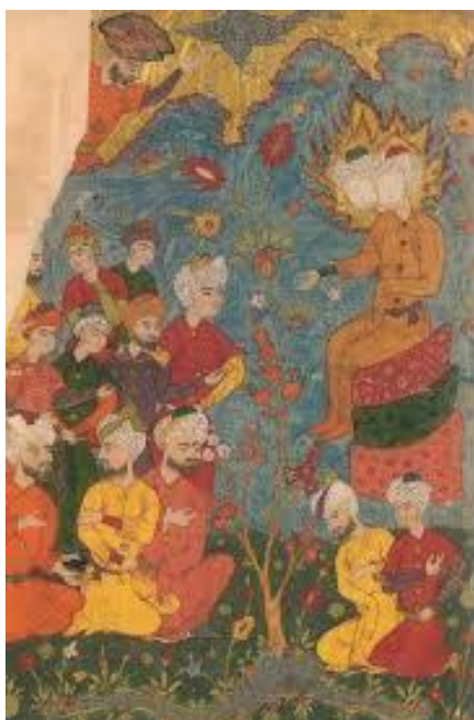
تصویر ۴: واقعه غدیر خم، فالنامه. دوره صفوی، موزه کاخ گلستان، تهران.