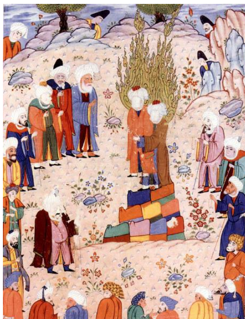
تصویر ۲: نگاره غدیر خم، نسخه احسن الکبار قرن ۱۶ میلادی، دوره صفوی، کاخ گلستان.

دوستانه در این نگاره بین افرادی موجود، می‌تواند گویای بیان آرام و بدون خشونت مسئله جانشینی علی (ع) باشد.