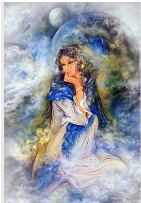
تصویر ۳: تصویر معشوق اثر استاد محمود فرشچیان. (منبع: نگارنده).