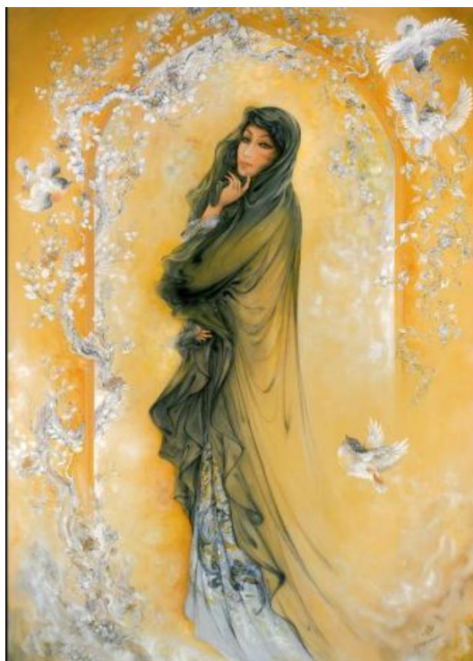
تصویر ۱: زن اثر استاد محمود فرشچیان.

تو از قبیله سوزان آتشی، شاید چنین که سرکش و پاک و بلندبالایی ( منزوی ، ۱۳۸۷ : ۳۶ ) .