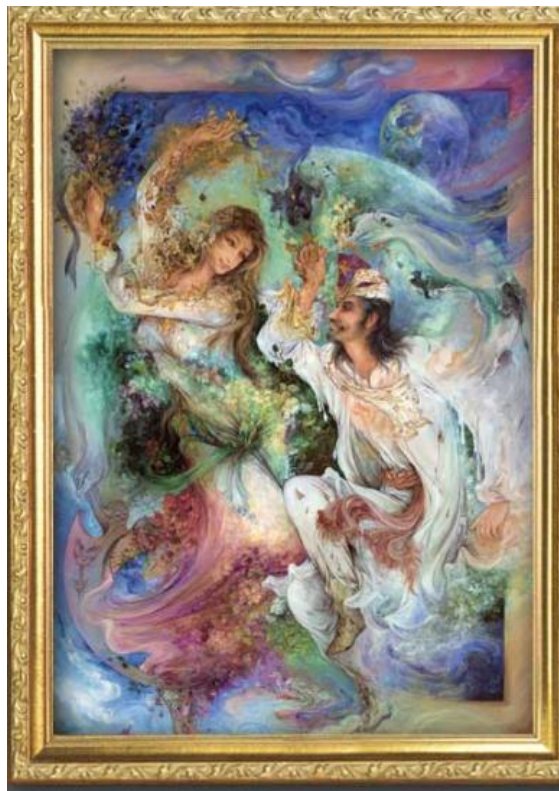
تصویر ۴: زن اثر استاد فرچیان.

نگاهت طولانی ترین بوسه است / به هنگام وداع / نگاهت سبزترین مزرعه هاست / که پرندگان سرگردان نگاهم را / در آلاچیق مژگانت / پناه می دهد / نگاهت / امن ترین جاده است / برای گریز / و بلندترین حصار است / برای عزلت / نگاهت / آرام ترین رودخانه است ( مهاجر ، ۱۳۸۹ : ۶۹۹).