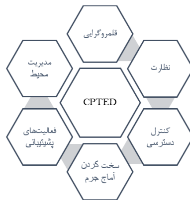
شکل ۱. اصول نظریه CPTED؛ مأخذ. (Cozens and Love, 2015: 396)

راحت‌تر از تغییر و مبارزه با ضعف‌های بشری و اصلاح شخصیت افراد است در نتیجه راه حل مناسب برای پیشگیری از وقوع جرم را کم کردن فرصت‌های مجرمانه می‌داند. این نظریه را می‌توان این‌گونه تعریف کرد طراحی مناسب و طراحی مناسب و کاربری مؤثر از محیط و ساختمان که منجر به کاهش جرم و ترس ناشی از جرم می‌شود به عبارت دیگر طراحی مناسب و استفاده درست از محیط می‌تواند علاوه بر پیشگیری از وقوع جرم، کیفیت زندگی را بهبود بخشد و ترس از جرم را کاهش دهد (Crowe, 2000: 46).