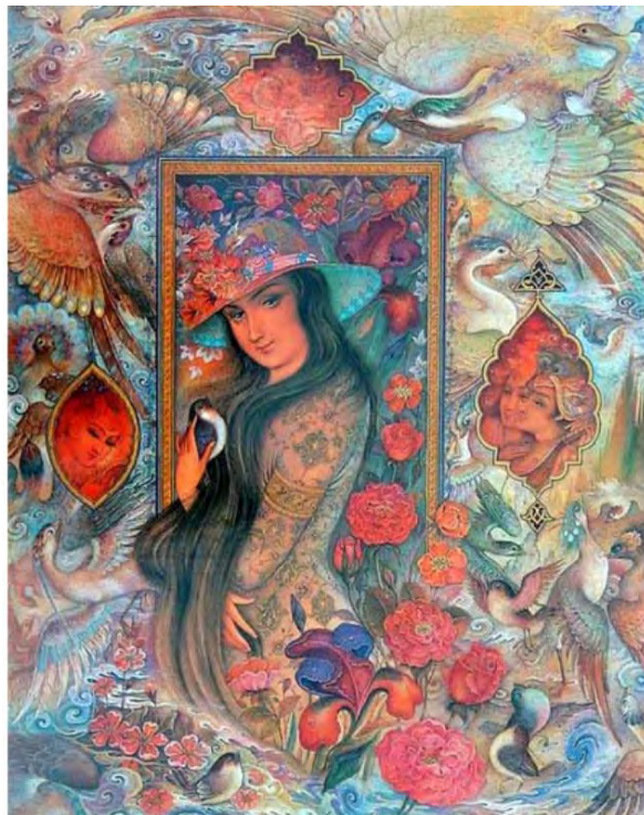
تصویر ۲: اثری از محمدباقر آقامیری، دوره معاصر. منبع (www.azizihonar.com)

شکل ظهور چهره‌های کم رنگ در حاشیه موضوع اصلی به چشم می‌خورد. در تصویر شماره (۲) می‌توان این شخصیت‌های پس‌زمینه را مشاهده کرد.