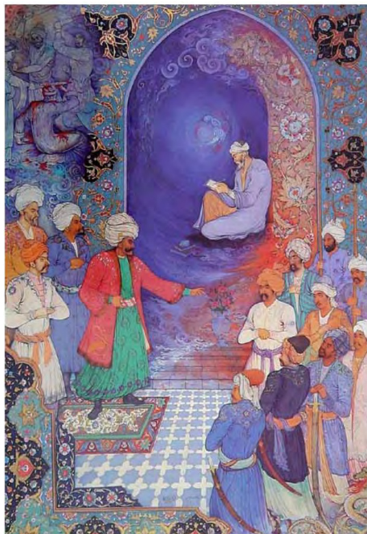
تصویر ۱: نگاره‌ای از محمدباقر آقامیری، دوره معاصر.