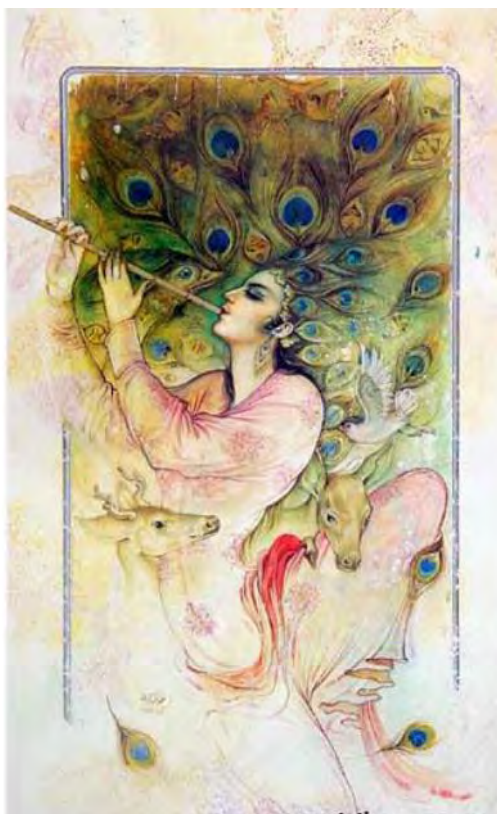
تصویر ۵: نقاشی از محمدباقر آقامیری، دوره معاصر.

نافش بسته بود. صورتی داشت با گوشت آویزان. لب پایش آنقدر کوتاه بود که انگار بدون هیچ خنده‌ای، همیشه لبخند می‌زد» (نجدی، ۱۳۹۵: ۲۵-۲۴). معمولاً چنین قیافه‌ای برانده‌ی یک پادو است و از پاکار با آن خصوصیات زشت اخلاقی قیافه‌ای بهتر از این نمی‌توان تصور کرد. در تصویر شماره (۵)، نیز نمونه‌ای از آثار محمدباقر آقامیری دیده می‌شود که نقاش در آن با تکیه بر ظاهر به شخصیت پردازی در نقاشی پرداخته است.