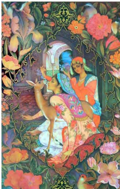
تصویر ۴: نقاشی از محمدباقر آقامیری، دوره معاصر.

آشکار می‌سازند» (ایرانی، ۱۳۶۴: ۲۰۰). در رمان «یوزپلنگانی که با من دویده‌اند» اعمال شخصیت‌ها، بیان‌گر خصوصیات روانی و درونی شخصیت، و نشان‌دهنده‌ی ابعاد ناشناخته وجود آن‌هاست. از رفتار مرتضی در داستان شب «سهراب‌کشان» با چگونگی شخصیت او می‌توان آشنا شد: «تابستان گذشته یکی از گوشه‌هایش را روی تنه‌ی درخت گردو گذاشت و به پدرش التماس کرد که او هم گوشش را روی درخت بگذارد. پدر گفت: نه. مرتضی با حنجره چوبی‌اش آنقدر زوزه کشید، آنقدر ناخن‌هایش را از پایین به بالا روی درخت کشید تا پدرش باور کند که درخت دارد قد می‌کشد. پدر داد زد: خیلی خوب دارد قد می‌کشد.» (نجدی، ۱۳۹۵: ۳۷). از این رفتار مرتضی برمی‌آید که خداوند نعمتی را که از بنده‌ای می‌گیرد، نعمتی بزرگ‌تر به او عطا می‌کند. مرتضی کرولال است اما خداوند به او بصیرت و بینشی داده که پیوسته در پی کشف رمز و راز امور طبیعت می‌باشد. اما پدر مرتضی به دلیل نداشتن چنین بصیرت یا نعمتی که خداوند به مرتضی داده بود تمامی استعدادها و توانایی‌های فرزندش را نادیده می‌گرفت و به او به چشم یک معلول ناتوان و بی‌استعداد نگاه می‌کرد تا جایی که حتی حاضر نبود برای دلخوشی او گوشش را بر روی تنه‌ی درخت بگذارد و حتی وانمود کند آنچه را که فرزندش شنیده، او هم شنیده است (همان: ۸۰). در نقاشی محمدباقر آقامیری نیز پردازش شخصیت از طریق رفتار دیده می‌شود در تصویر شماره (۴) این تصویرگری مشهود است.