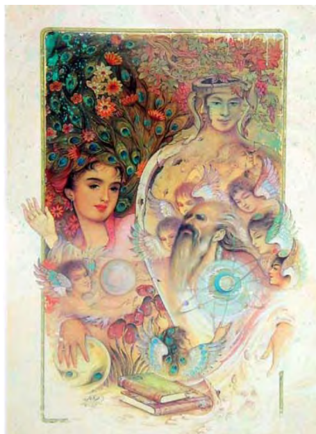
تصویر ۶. نقاشی از آثار محمدباقر میری. دوره معاصر.

چنان با هنرمندی تمام توصیف می‌کند؛ که مخاطب آن صحنه‌ها را براحتی در ذهن خود مجسم می‌کند. به‌عنوان نمونه صحنه‌های مربوط به تصاویر روی پرده در داستان «شب سهراب‌کشان» آن‌چنان زیبا بیان شده است؛ که مخاطب همه آن تصاویر را گویی دارد مثل یک فیلم سینمایی می‌بیند. «فردوسی سرش را برگرداند و به سردارانش گفت: بروید آن آتش را خاموش کنید، اسفندیار بی‌آن‌که نیزه را از چشمش بیرون کشد سوار اسب شد، سهراب با همان دشنه‌ی فرورفته در استخوان دنده‌اش اسب را زین کرد و سوار بر اسب آن‌قدر استخر را دور زد تا سیاوش، چشم از خون ریخته زیر پاهایش بردارد و پیشاپیش اسب از تاریکی پشت پلکان‌های طوس بیرون آید» (نجدی، ۱۳۹۵: ۴۵). یا در داستان «چشم‌های دکمه‌ای من»، صحنه‌ی پرتاب شدن عروسک، فاطمی و مادرش به زیبایی توصیف شده است. توصیف‌گری برای نمایش شخصیت مورد نظر در آثار محمدباقر میری نیز دیده می‌شود. در تصویر شماره ۶، این توصیف‌گری مشهود است.