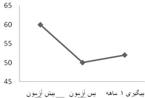
نمودار ۲) تغییرات نمره آزمودنی در شاخص GSI در مراحل پیش آزمون، پس آزمون و پیگیری

کل پاسخ‌های داده شده محاسبه کردیم و در مرحله بعد نمره به دست آمده را بر اساس نمره هنجاری گروه بیماران روان‌پزشکی سرپایی استاندارد کردیم و نمره استاندارد شده در مراحل پیش آزمون، پس آزمون و دوره پیگیری را با هم مقایسه کردیم که نتایج آن در نمودار ۲ ارائه شده است.