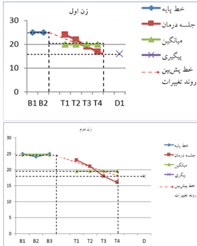
تصویر ۱. روند تغییر نمره‌های افسردگی زنان مبتلا به افسردگی پس از زایمان در درمان CBT در مراحل خط پایه، درمان و پی‌گیری ۱ ماهه