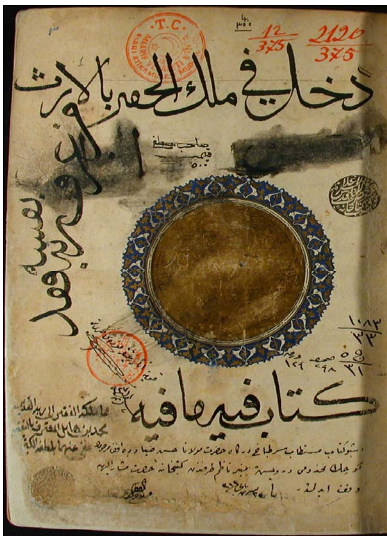
تصویر شماره ۱

ترمذی- مرشد روحانی و معنوی مولانا- مؤید این نکته تواند بود. سخنان ناب و درخشان شمس - که در تصحیح علمی و انتقادی استاد محمدعلی موحد به طور قطع از آن شمس تبریزی است- می توان معارف برهان‌الدین، به عیان مشاهده کرد (نک. محقق ترمذی، ۱۳۷۷: ۶۴-۶۰).