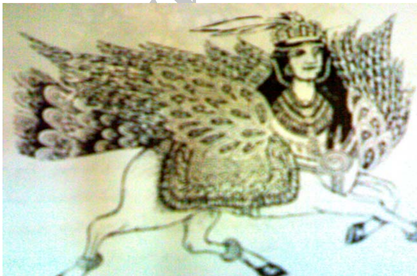
تصویر شماره ۳