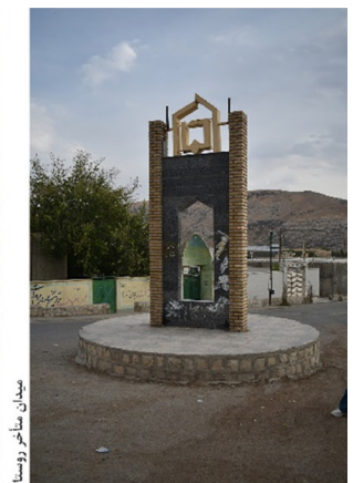
تصویر ۳. میدان متأخر جایگزین میدان میل به‌مثابهٔ یک میراث تاریخی و آیینی و مرکز روستا.