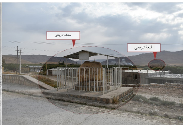
تصویر ۱. تحلیل سایت میراثی در محدوده قلعه باستانی و سنگ تاریخی روستای خسروآباد و ظرفیت نظرگاهی روستا بر سایت میراثی